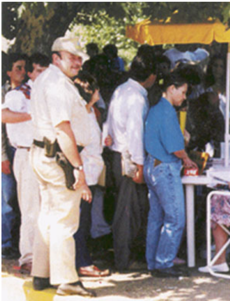
Figure 1 - Queue pour obtenir des papiers à la Direction Nationale des Migrations, siège central de Buenos Aires, pendant la régularisation massive de 1992 (cliché de S.M. Sassone)

Au premier plan, un policier contrôle le bon déroulement de la demande de papiers, pour lesquels les migrants boliviens du second plan sont venus si nombreux. Devant l'afflux des migrants, la DNM a installé des bureaux de renseignement dehors. Sur le million et demi de migrants présents en Argentine, la moitié serait illégale. L'obtention de papiers jusqu'à l'application du programme « Patria Grande » est un véritable casse-tête, un labyrinthe administratif digne d'un univers kafkaïen.