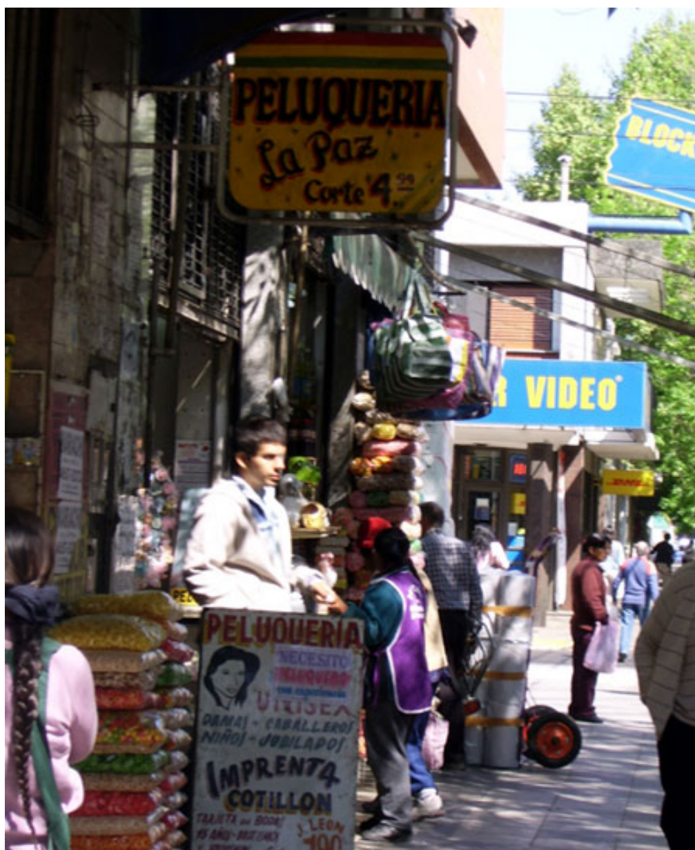
Figure 3 - Un territoire marqué par les migrants : le quartier de Liniers, Buenos Aires.

Dans le centre de Buenos Aires, ce quartier est approprié par les migrants boliviens et, dans une moindre mesure, péruviens. Au premier plan, un salon de coiffure porte le nom de la capitale bolivienne et ses prix défient toute concurrence. Des migrants d'origine bolivienne (les femmes aux longues nattes et au tablier, premier, troisième plan) viennent acheter des produits alimentaires typiques de Bolivie dans les boutiques voisines (des sacs de pâtes, de chips et pop corn colorés en grande quantité). Les produits sont empilés, posés sur la rue, accrochés : cette manière de présenter rappelle plus les boutiques de La Paz que celles de Buenos Aires. Au dernier plan, de l'autre côté de la rue, des magasins courants à Buenos Aires : « Blockbuster », chaîne internationale de location de vidéos, et « DHL », spécialisé dans les envois de colis.