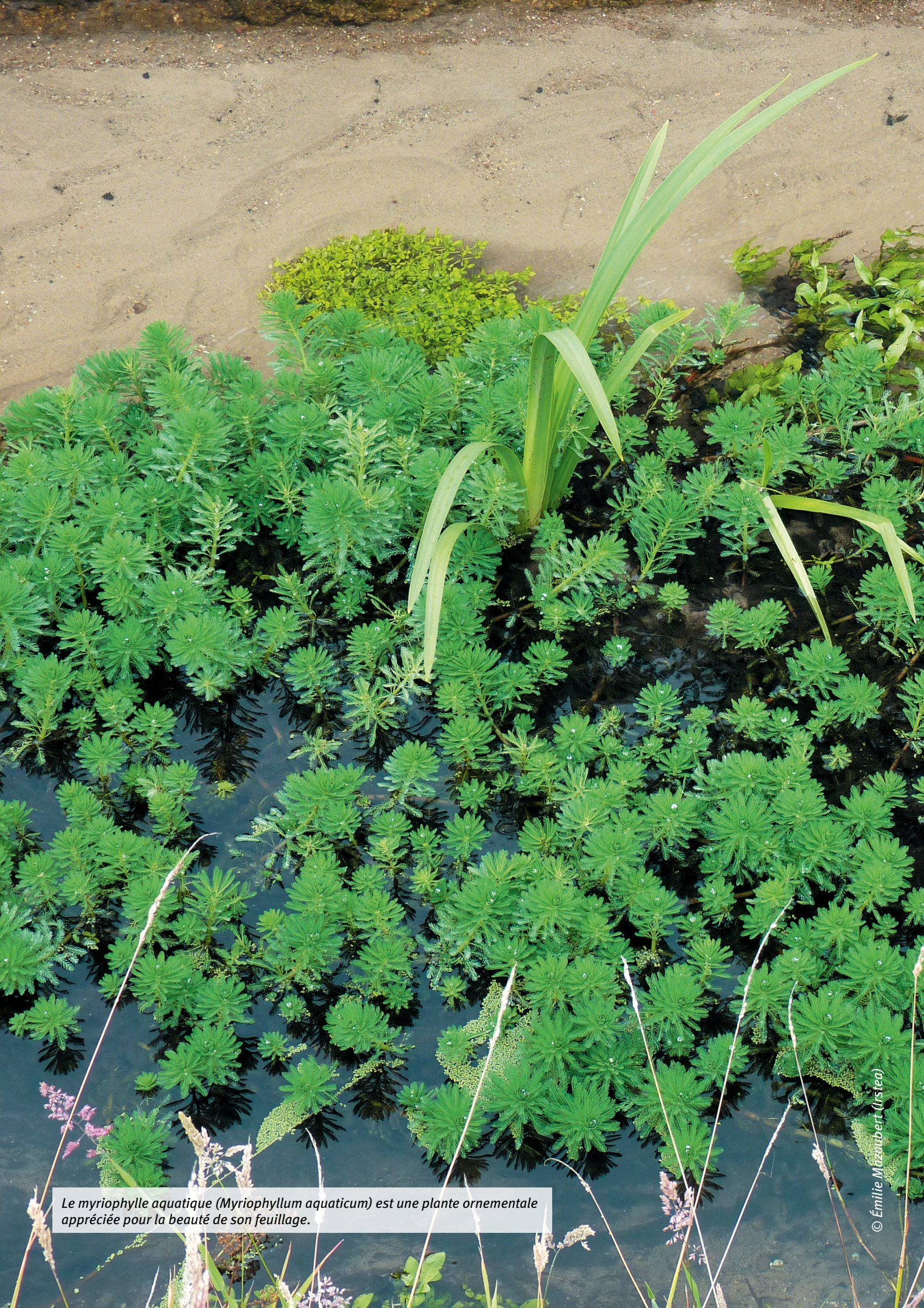
Le myriophylle aquatique ( Myriophyllum aquaticum ) est une plante ornementale appréciée pour la beauté de son feuillage.