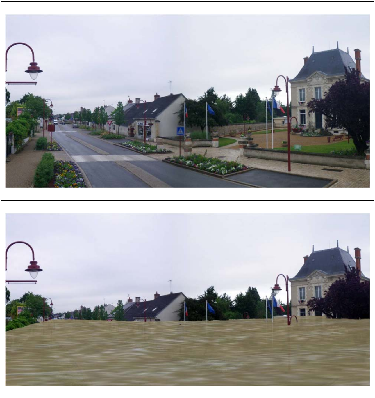
Figure 1 : DREAL Centre, matériel pédagogique à l'appui de la révision des atlas des zones inondables de la Loire, 2010