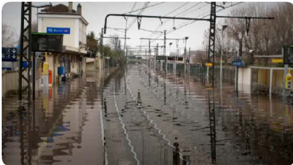
Figure 2 : Conseil général du Val de Marne, Festival Oh-Val (images virtuelles reconstituant les niveaux de la crue de 1910 sur la ligne 8 du métro à Créteil et dans la gare RER de Villeneuve-Triage), 2008