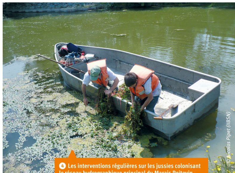
4 Les interventions régulières sur les jussies colonisant le réseau hydrographique principal du Marais Poitevin ont permis de les faire régresser de telle sorte que des arrachages manuels réguliers suffisent à les réguler. Cette technique n'est pas du tout applicable à des colonisations denses sur des surfaces importantes.

Enfin, au-delà des divergences éventuelles d'objectifs, une telle démarche rencontre souvent des difficultés de mise en œuvre liées aux calendriers de fonctionnement quelquefois très différents entre financeurs, gestionnaires et chercheurs. Faire coïncider le temps de la gestion avec celui de la recherche n'est pas chose facile : de la confrontation entre les souhaits de rapidité de mise en œuvre des actions et ceux de posséder des connaissances jugées suffisantes pour lancer ces actions peuvent naître incompréhensions ou rejets. Toutefois, il est à noter que chaque fois que des contacts réguliers (à défaut d'être permanents) ont pu être maintenus durant des périodes dépassant quelques années entre des gestionnaires confrontés à des questions récurrentes de gestion et des techniciens ou chercheurs disponibles pour les aider, les calendriers de fonctionnement qui viennent d'être évoqués sont