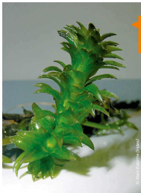
5 Bouture d'une égérie dense ( Egeria densa ).

Les oppositions sociales qui peuvent se produire dans certains cas nécessitent alors des efforts complémentaires de communication et d'explication, risquant de retarder la mise en œuvre des interventions : elles peuvent éventuellement être évitées ou réduites si ces efforts sont entrepris en parallèle aux réflexions sur les modalités d'intervention.