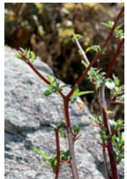
Y. Dumas, Cemagref

Cette espèce manifeste également une forte toxicité envers les mollusques (propriétés molluscicides). Aldea et al. (2005) évaluent en effet à 150 mg/l la dose efficace de poudre de baies sèches de Phytolacca americana dans l'eau pour intoxiquer des espèces invasives d'escargots dans un bassin aquacole (75 % de la population est détruite au bout de 30 jours). Si l'on prend pour exemple l'individu (I1) étudié par Dumas en 2008 (données non publiées) qui a produit 242 g de fruits secs, il serait capable à lui seul d'intoxiquer 1 613 litres d'eau à une concentration létale pour ces gastéropodes. De tels niveaux de toxicité contribuent à expliquer le développement de cette espèce à l'échelle de notre territoire. Pas très étonnant dans ces conditions que Campana et al. (2002) évoquent la