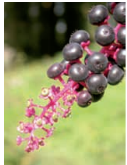
(3) Grappe de fruits mûrs à la base et en cours de formation à l'extrémité – (Domaine des Barres, Nogent-sur-Vernisson (45) – 2006)

Valmon de Bomare (1791) rapporte que les pousses terminales et les feuilles sont consommées en guise d'épinards aux Antilles, en Angleterre et en Suède, mais il semble que les feuilles soient toxiques dès lors qu'elles ne sont pas consommées très jeunes, et qu'elles aient mauvais goût. Dans les années 1850, Van Houtte, un horticulteur belge de Gand, développe la culture d'une espèce asiatique ( Phytolacca acinosa )