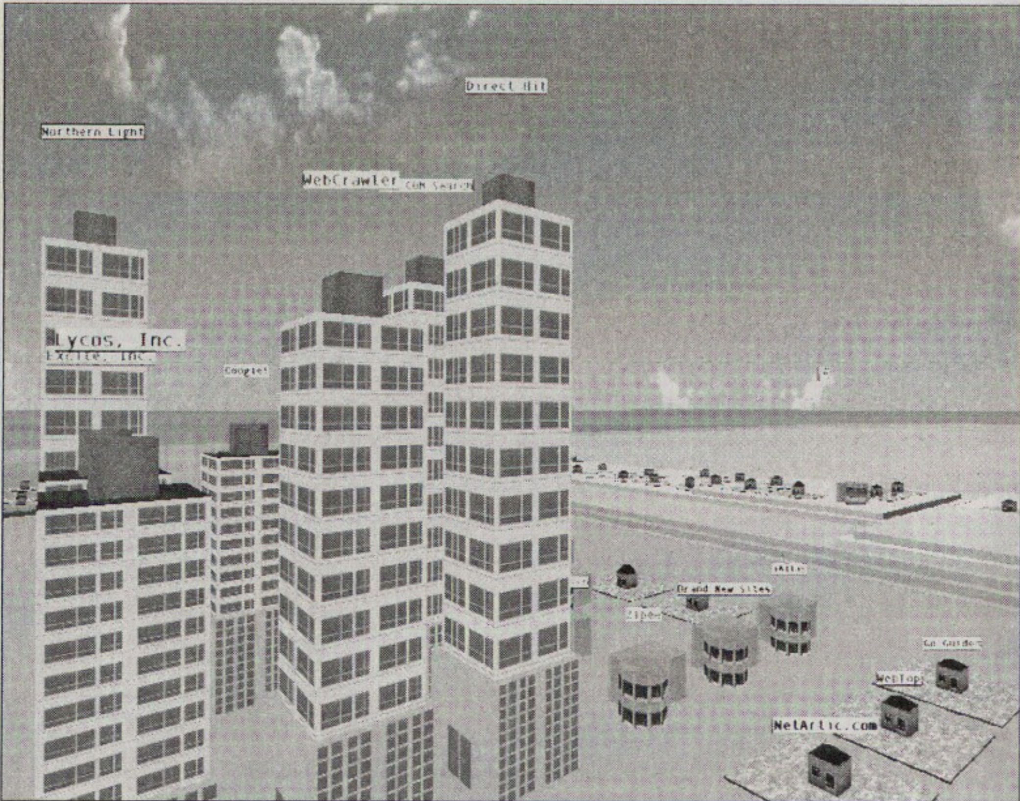
Figure 7 : ville 3D