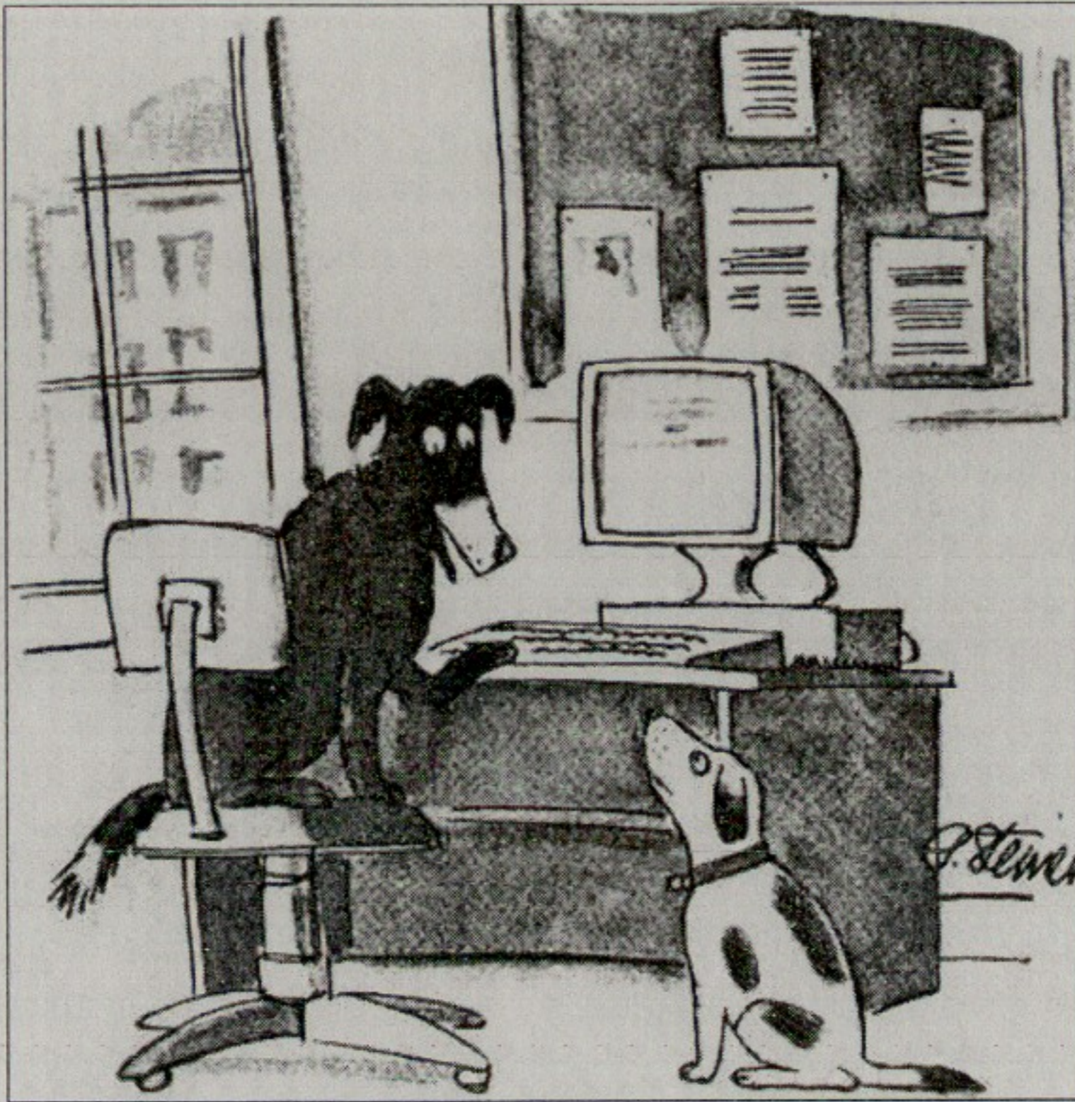
Figure 1 : “ On the Internet, nobody knows you’re a dog ”

personnes dans l’Internet qui savent que t’es un chien = 0” (Treese, 1994 [2002]). Cet énoncé poussait à la limite la mobilisation symbolique de la forme animale, en présupposant que le lecteur même était un chien et qu’il cherchait soigneusement à cacher sa nature. La place de l’homme et celle de l’animal commençaient à coïncider curieusement. Le discours du “posthumain” qui émergeait dans ces mêmes années (Halberstam et Livingstone, 1995 ; Pepperel, 1995 ; Hayles, 1999 ; Badmington, 2001 ; Marchesini, 2002) radicalisa cette option : la condition de l’homme et celle de l’animal étaient vouées à être transcendées par le nouveau paradigme anthropologique résultant de l’harmonisation de l’affectivité distillée par les hommes et de l’information stockée dans les machines. Fédérés par un destin biologique commun, l’homme et l’animal occupaient la même place dans une échelle évolutive ayant son climax dans le corps virtuel posthumain. Les diverses productions visuelles de la cyberculture (spots et émissions télévisés, vidéoclips musicaux, magazines, objets de design) rebondissaient avec insistance sur cette nouvelle représentation.