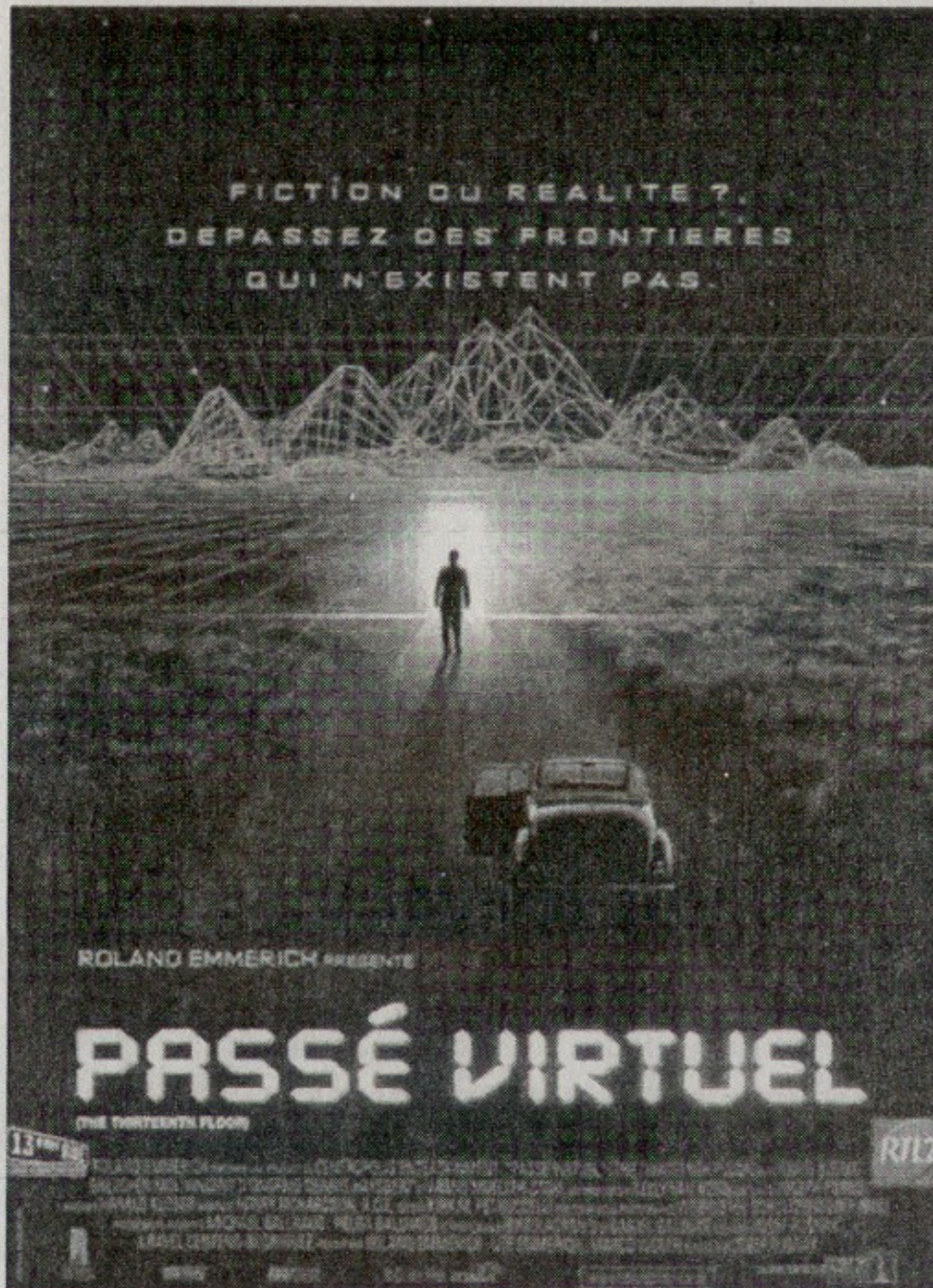
Figure 2 : the Thirteenth Floor

Spéciale A". Imagerie classique de l'ermite sacré, entouré des médiateurs divins évoluant entre ciel et terre, symboles d'omniscience. 8 Dans The Thirteenth Floor , la place et le rôle de l'oiseau sont du même ordre. Lorsque le héros, Douglas Hall, arrive aux "Confins du monde", il voit le paysage s'abolir en un quadrillage vert fluorescent, et comprend que sa réalité est une simulation numérique [fig. 2].