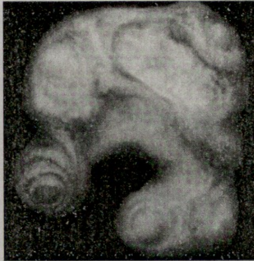
Figure 3 : "le GamePod"