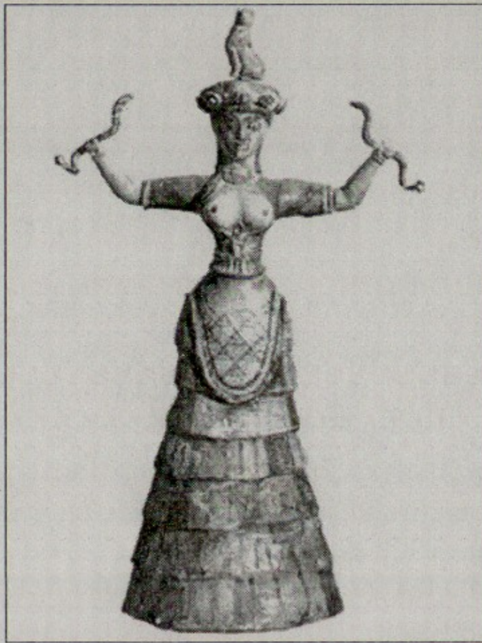
Figure 4 : déesse aux serpents, Musée Archéologique de Hérakleion (Grèce)

Bien que la naissance dans le monde des vivants l'ait doté d'un physique différent - sa peau est rose, sa musculature élastique et tendre -, il a conservé de sa nature reptilienne initiale le pouvoir de régénérer son corps, assumé mécaniquement par les nano machines.