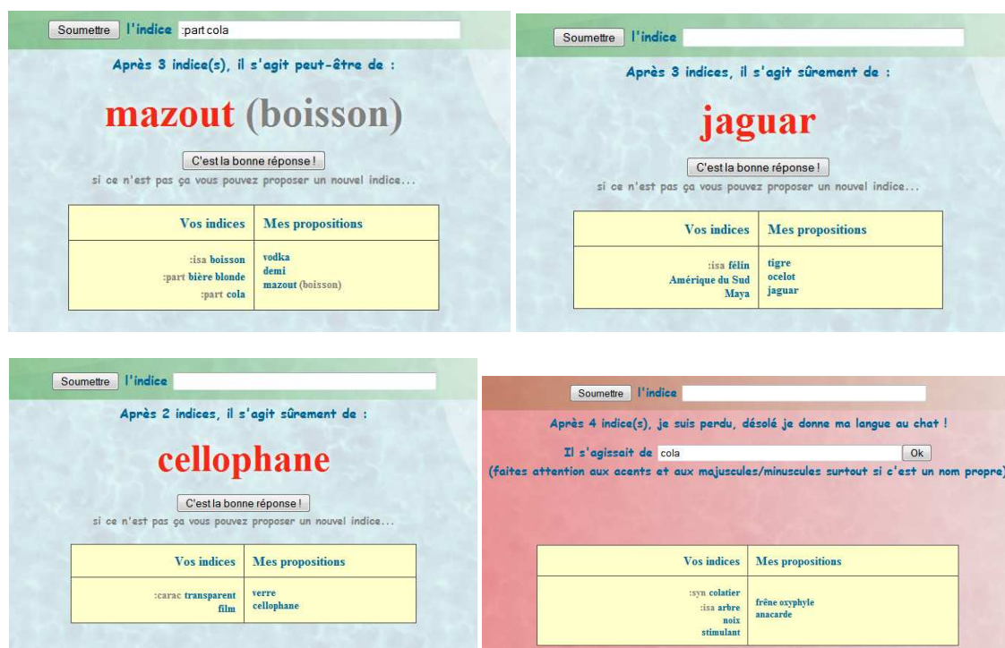
Figure 1 : Quelques exemples de parties. Dans les trois premiers cas, AKI a trouvé le terme cible. Dans le quatrième cas, ne pouvant plus faire de proposition, AKI a abandonné et l'utilisateur a saisi la bonne réponse (il s'agissait donc d'une utilisation ludique de AKI).

Les utilisateurs d'AKI ont la possibilité de faire précéder leur indice de mot-clé faisant référence à des fonctions lexico-sémantiques. Actuellement il est possible d'utiliser dix fonctions : hyperonymie, hyponymie, synonymie, antonymie, domaine, matière, lieu (lieu typique où l'on peut trouver ce que l'on cherche), caractéristique, holonymie, méronymie. Elles correspondent toutes à un type de relation existant dans le réseau JeuxDeMots.