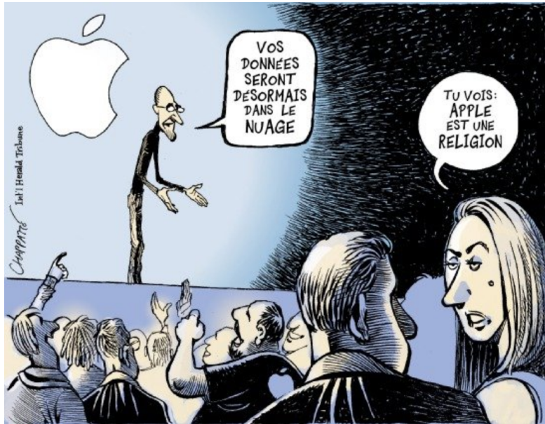
Figure 1. Illustration du quotidien International Herald Tribune (Chappatte)