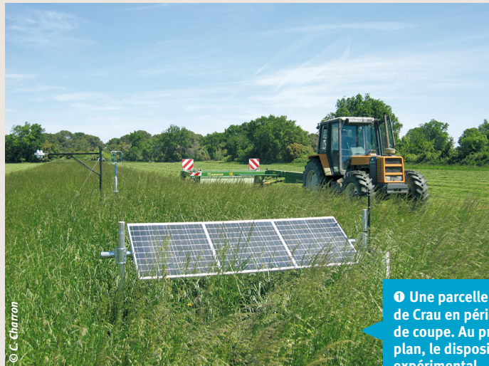
① Une parcelle de foin de Crau en période de coupe. Au premier plan, le dispositif expérimental.

Il ressort de ces expérimentations que le pilotage tensiométrique modifie la fréquence des arrosages par rapport au pilotage traditionnel. Il conduit à irriguer plus souvent (tous les sept à huit jours en moyenne) en été. L'analyse