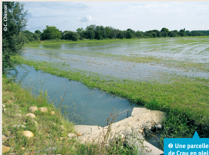
② Une parcelle de foin de Crau en pleine irrigation.