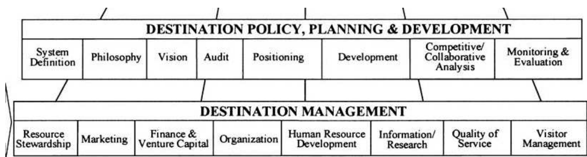
Fig. 1. Destination competitiveness and sustainability – extrait partiel - (Ritchie et Crouch, 2000)

Le modèle de (Crouch et Ritchie, 1999; Ritchie et Crouch, 2000) , parmi les plus répandus, propose une carte des éléments constituant la destination et des fonctions que le DMO doit assurer (voir la figure 1). Celles-ci se partagent entre management simple (gestion des ressources, marketing, organisation...) et fonction dites "politiques", que nous proposerons de rattacher à la stratégie : délimiter le système, établir une vision partagée, arrêter un positionnement, opérer les choix stratégiques de développement (ce qui comprend les options de production, les choix d'affectation de ressources financières, de gestion de ressources humaines) et des choix de coopération-compétition. Enfin ce même étage stratégique inclut aussi les fonctions de diagnostic, et de contrôle-évaluation.