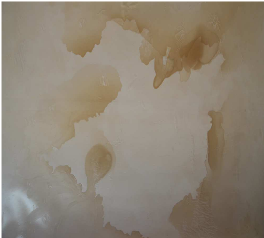
Figure 3 : Pascal PINAUD Sans titre (91A04) Février-mars 1991. Tirage de plans d'architecture et de vernis 209x177. Collection privée MNJC. Nice

Figure 3, parfois emplies d'asphalte 18 ou celles CANES (tampon) ou de DOLLA qui use