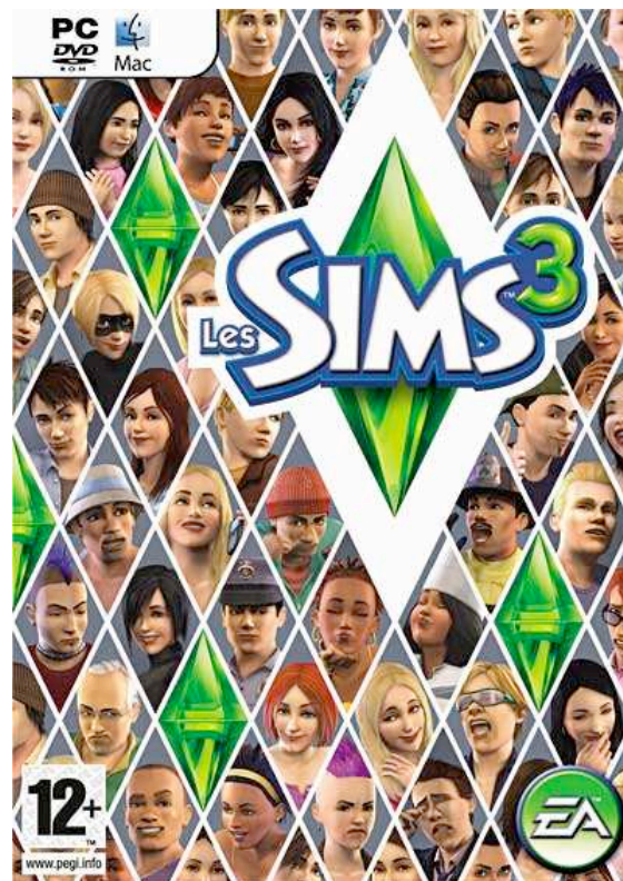
Les Sims 3

La troisième et dernière jaquette s'organise autour d'une déclinaison géométrique du losange qui dans le jeu signale le Sim commandé par le joueur. Dans chacune des cases du réseau ainsi défini figure, en gros plan, le visage d'un personnage.