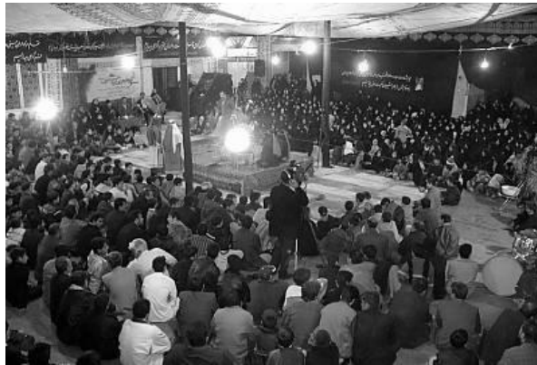
Figure 63 : Ta'ziye de 'Abbâs , 1996, Iranian Dramatic Art Center

l'assistance acclame Husayn et se frappe la poitrine. Lorsque la salle est bien chauffée, l'orchestre joue une marche funéraire et les acteurs montent sur scène. [Figure 63]