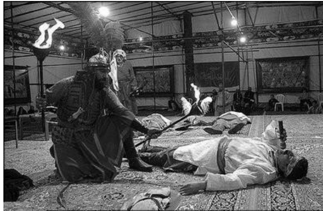
Figure 64 : Shemr tue les descendants du Prophète, photo postée en 2009 par un anonyme sur le site http://forums.whyyeprotest.net/threads/taziye-political-theatre-and-propaganda-in-shiite-islam-green-good-red-bad.70442/

citadins (quartiers, métiers) et villageois rivalisent pour édifier ou décorer les tekiyye . Les séances sont données dans un espace circulaire au centre duquel est édifée une plate-forme ( saku ) symbolisant le camp des assiégés. Les spectateurs prennent place autour d'elle, les riches dans des loges, les pauvres par terre ou sur des gradins, les hommes et les femmes séparés mais se voyant. Des boissons et des mets sont distribués (Calmard in Corvin, 2008 : 722-723).