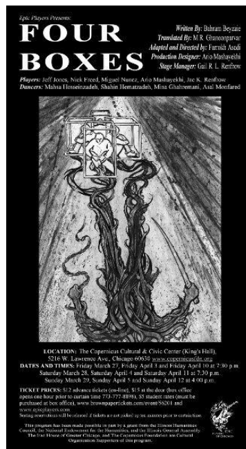
Figure 67 : Affiche de la pièce de Beyzâ'i jouée à Chicago en 2009 par la troupe des Epic Players http://www.epicplayers.com/upcoming

Le même esprit imprègne l'œuvre de Bahrâm Beyzâ'i (né en 1938). Quatre boîtes (1967) est une allégorie de la fabrication par une société de ses propres dictateurs. Quatre personnages, désignés chacun par une couleur, symbolisent les différentes composantes de la société iranienne : le jaune pour les intellectuels, le vert pour le clergé, le rouge pour les marchands, le noir pour les ouvriers. Afin de préserver leurs intérêts respectifs face à une menace extérieure mal identifiée, les quatre personnages contribuent à construire un épouvantail devant leur servir de gardien. Mais celui-ci prend inopinément vie, les monte les uns contre les autres, les maltraite et les terrorise jusqu'à les forcer à construire quatre boîtes dans lesquelles ils sont confinés. [Figure 67] Cependant, cela n'est possible qu'à cause de leurs défauts et vices respectifs (lâcheté, délation, appât du gain et égoïsme, mépris et perte du sens des réalités, incapacité à communiquer, ignorance et obscurantisme). De même, leur enfermement est semi-volontaire, car ils ont finalement plus peur les uns des autres que de l'épouvantail.