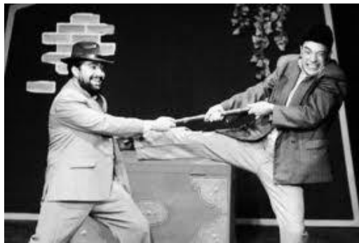
Figure 56 : Spectacle moderne de Takht-e Khowzi , photo sans mention d’auteur L. Anjo, « Le Siâh-bâzi, théâtre comique populaire d’Iran », La Revue de Téhéran , 42, 2009, URL : http://www.teheran.ir/spip.php?article957 , © La Revue de Téhéran, 2009

Les spectacles de ce type recouvrent des thématiques très diverses : historique ou épique ( Bijan et Manije , Khosrow et Shirin 4 , Moïse et le Pharaon , Joseph et Zoleykha , Harun al-Rashid ), liées à la vie quotidienne ( Hâji Kâshi et son gendre , Le Hâji pilier de mosquée , Le Mariage de Holu , Le Boutiquier et sa femme ), relevant de l’imaginaire religieux ou folklorique ( Sheykh San’ân , Les Quatre derviches , Now Ruz Piruz , L’Épée de Salomon , Pahlavân kachal ). Il existe une ressemblance certaine entre ces spectacles comiques et l’ ortayunu turc . [Figure 56]