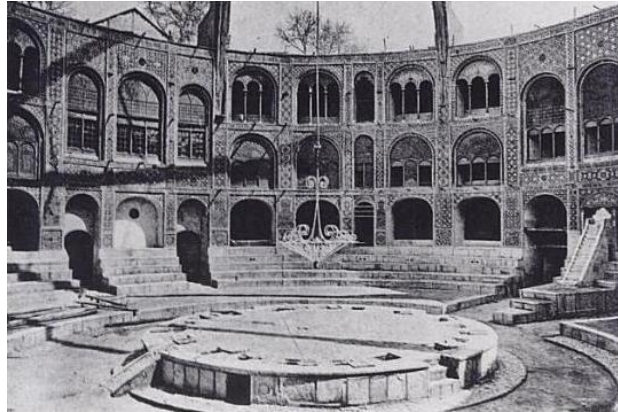
Figure 62 : Tekiye Dowlat, photo de Henry Binder, 1887, extraite de The World Encyclopedia of Contemporary Theatre , ed. Don Rubin, publiée sur Wikipedia, URL: http://en.wikipedia.org/wiki/File:Takiyeh-e_Dowlat.JPG

La grande impulsion pour la composition et la représentation de ces drames fut donnée par les Qajars (1794-1925). Sous le patronage des hauts dignitaires et de la cour impériale, on édifia de plus en plus de lieux de représentations (des tekiyye , ou hoseyniyye , fixes ou temporaires). La plus remarquable de ces constructions, Tekiyye Dowlat, fut édiflée à Téhéran, près des palais royaux, vers 1870. [Figure 62]