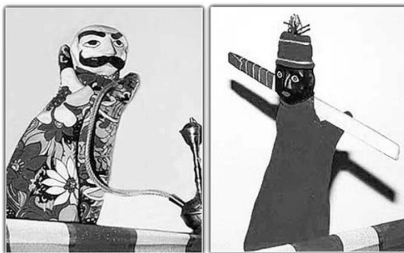
Figure 57 : Marionnettes de Pahlavan Kachal et Mobârak

dissimuler le haut de son corps et sa tête, à moins que le spectacle ne soit donné sous une tente rudimentaire ( kheyme ) qui donnera son nom au jeu ( kheyme shab-bâzi , « la tente du jeu nocturne »). Le jeu est improvisé sur un canevas sommaire. Au moins cinq marionnettes interviennent : le principal personnage est Kachal Pahlavan (« le brave chauve »), sorte de matamore aussi couard que rusé, hypocrite et tricheur, qui tourne en ridicule les mollahs, courtise les femmes et parfois les jeunes garçons, et finit par être démasqué ; il ressemble beaucoup au personnage de Hacivat dans le karagöz . Sheytân (« Satan ») est le tentateur qui embarque Kachal Pahlavân dans des aventures douteuses ; Rostam est le héros de la célèbre épopée persane du Livre des Rois , symbole de force et de virilité, qui prête parfois assistance à Kachal ; Âkhund (« religieux chiite ») est le maire et théologien du village, un naïf qui se fait voler, enlever femme et fille, chasser de sa propre maison, et se laisse entraîner à boire et à danser ; Zan (« femme »), enfin, est la jeune fille innocente, objet du désir de Kachal. La représentation est précédée d'une animation par un bouffon à la tête d'un petit orchestre composé d'une flûte, d'un tambour et d'un luth (Floor, 2005 : 65-69). [Figure 57]