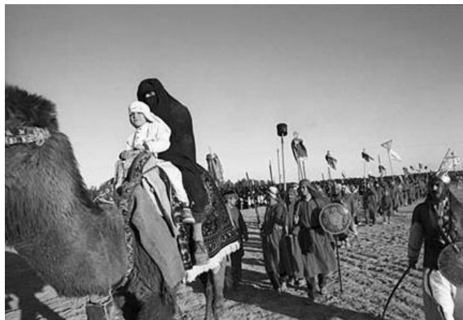
Figure 65 : Les survivants sont emmenés captifs à Kufa, photo postée en 2009 par un anonyme sur le site http://forums.whyyeprotest.net/threads/taziye-political-theatre-and-propaganda-in-shiite-islam-green-good-red-bad.70442/

Des ta'ziye féminins étaient joués dans les patios ou salles de fête des notables devant le public des harems par des récitatrices-déploratrices surnommées mollâ ; elles reprenaient évidemment les épisodes dont les personnages principaux sont des femmes, comme celui de Shahr Bânu ou du mariage de la fille de Qoreysh (Beyzâ'i, 1995 :160). Il existait également des épisodes parodiques centrés autour du personnage de l'esclave noir de l'Imam Hoseyn,