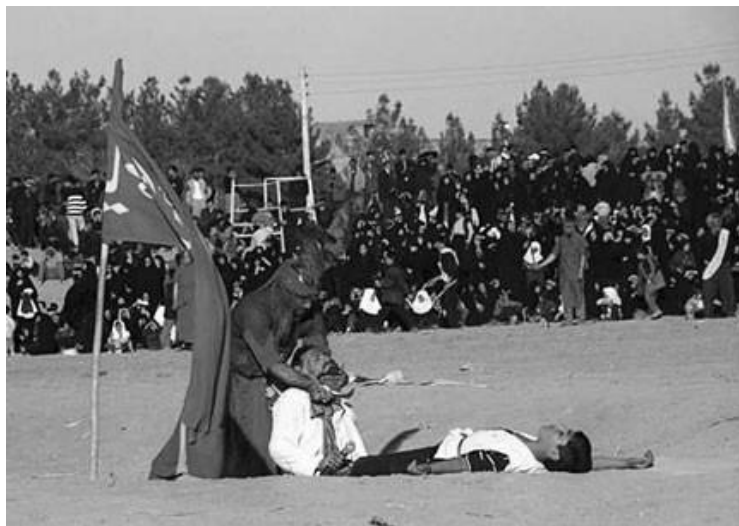
Figure 61 : Meurtre de Hoseyn et de son fils

à l'encontre des Omeyyades et furent à l'origine de nombreuses conversions à l'islam. Abandonnés pendant trois jours dans le désert de Karbala, les corps des martyrs furent enterrés par de pieux habitants d'un village voisin. Quarante jours après le massacre, les fidèles allèrent se recueillir sur leurs tombes : la commémoration des martyrs de Karbala était née. Amplifiés par les « traditionnistes » et les narrateurs, les épisodes de ce martyre devinrent un élément important de la piété populaire chiite. La commémoration s'inscrit sous le signe de la déploration (d'abord celle des Ahl al-Bayt , famille du prophète), du repentir (celui des chiites de Kufa qui ont abandonné Husayn), de la vengeance (celle d'une lignée de vengeurs des Imams dont Mukhtâr est le premier) (Malekpour, 2004 : 20-31 ; Calmard in Corvin, 2008 : 721-723).