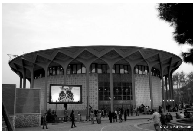
Figure 70 : Le Théâtre de la Ville ( Te'atr-e Shahr )

Bien que le théâtre demeure sous la tutelle de l'État, certains auteurs tendent parfois à un théâtre social, alors que l'on investit exclusivement dans le théâtre religieux. Le Centre des arts dramatiques maintient le Festival de Fajr dans la continuité du festival de Chiraz en s'efforçant de préserver ses relations avec le théâtre mondial et le théâtre traditionnel. Parmi les auteurs contemporains, citons Mohammad Sharmshir, Amir Rezâ Kuestâni, Rezâ Gorân, Pari Sâberi, Hâmed Tâheri, dont l'œuvre sera présentée dans l'article de Liliane Anjo.