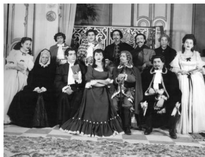
Figure 66 : Tartuffe de Molière joué au Théâtre Sa'di en 1952