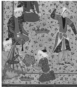
Figure 54 : Musiciens et danseuse, détail d'un manuscrit de La Roseaie de Sa'di, Shiraz, 1569 F. Richard, Splendeurs persanes , Paris, BNF, 1997, © Bibliothèque Nationale de France, 1997

Aux débuts de l'islam, le califat arabe et les cours des gouverneurs provinciaux s'inspirent fortement des modèles iraniens en matière de culture et de protocole ; les cours de Damas et Bagdad accueillent des chanteurs iraniens ; des farces ( shamajât ) sont jouées pour le Nouvel An par des acteurs masqués. À partir du XI e siècle, une différenciation s'établit entre les musiciens d'une part, et les acteurs et acrobates d'autre part. Un responsable des divertissements s'occupe du recrutement des poètes ménestrels ( khunyâgar ), des musiciens-chanteurs ( motreb ) et des conteurs ( qavvâlân ou naqqâlân ) (Floor, 2005 : 29-30). [Figure 54]