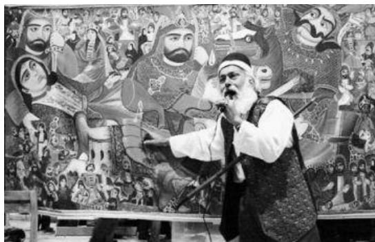
Figure 60 : Pardeh-Khâni