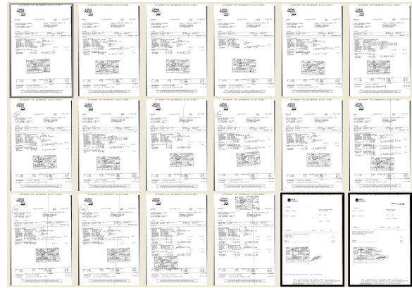
FIGURE 2 – Classification assistée. Les documents sont triés par similarité décroissante. La première image encadrée en gris est l' image de référence . Les deux images encadrées en noir ont été sélectionnées par l'utilisateur car elle n'appartiennent pas à la même classe.

Le tableau 2 récapitule les résultats obtenus lors de la classification de 4 bases d'images de documents de type "ressources