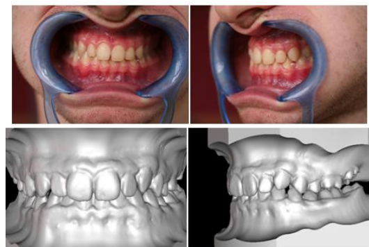
Figure 1 : Images réelles et virtuelles des vues de face et de profil

où M_{mand} est un point 3D de la mandibule et m_{i,mand} sa projection sur la photographie i . La transformation T est estimée en recherchant la meilleure correspondance entre des points localisés sur le modèle 3D de la mandibule et leurs projections dans les photos couleurs. Comme précédemment, l'équation 3 est minimisée par l'algorithme de Levenberg-Marquardt à partir de l'identité (figure 2) après une initialisation par une légère translation.