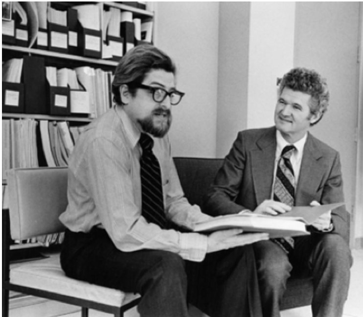
Figure 4 Louis Nirenberg et Peter Lax.

Selon, Andy Majda, "Courant importa ici la tradition de Göttingen – des mathématiques en tant que science – à cause des événements qui avaient lieu dans l'Allemagne nazie avant le déclenchement de la Deuxième Guerre Mondiale. Il eut ensuite la chance d'être entouré de ce groupe d'étudiants formidables – Joe Keller, Peter Lax, Cathleen Morawetz, Louis Nirenberg, Martin Kruskal, Harold Grad – qui devinrent ensuite parmi les mathématiciens les plus importants de leur génération. Lui et Kurt Friedrichs les ont fait grandir d'une manière remarquable. Il fut aussi l'un des rares mathématiciens qui réussit à profiter de la Deuxième Guerre Mondiale pour se faire financer par le gouvernement, mettant en avant le rôle de NYU dans le domaine des mathématiques appliquées et en soulignant les avantages que la défense nationale pourrait en tirer. Aujourd'hui, l'Institut Courant est l'endroit le plus connu au monde pour les mathématiques et leurs applications. C'est une success story incroyable."