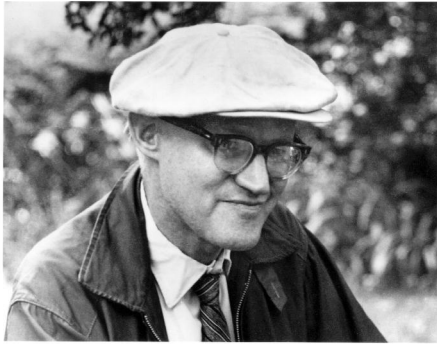
Figure 1 Kurt O. Friedrichs

L'affection de Courant pour les jeunes était notoire. D'après Louis Nirenberg, Courant adorait être parmi eux et être attisé par leur vigueur intellectuelle ; il invitait souvent les étudiants de troisième cycle 4 dans sa maison à New Rochelle 5 . Nirenberg explique : "Une fois que nous étions là, nous réalisons peu à peu que c'était pour enlever les mauvaises herbes de son jardin. J'ai découvert récemment que son professeur, Hilbert, faisait de même. Courant avait beaucoup d'initiative, et une grande imagination. Et il a eu de brillants étudiants : Kurt Friedrichs, Hans Lewy et bien d'autres. Il était très chaleureux, doté d'un humour débordant et très vif d'esprit."