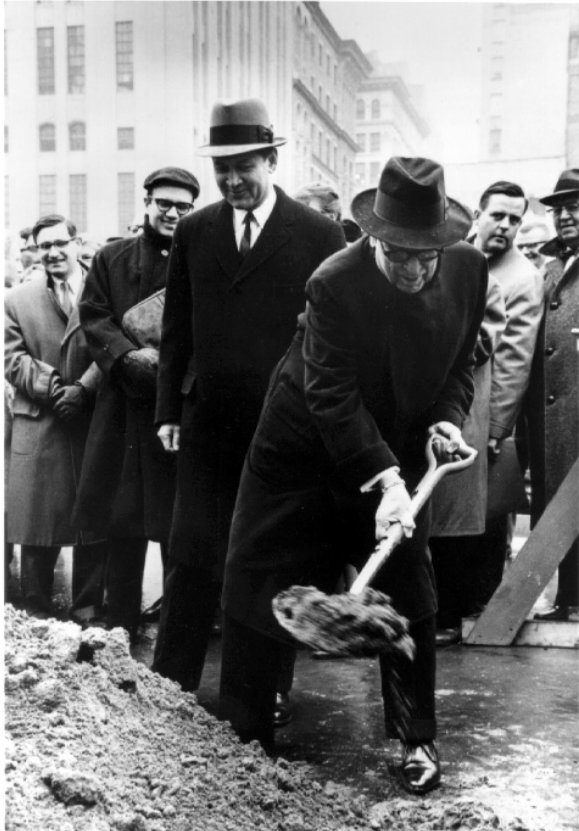
Figure 8 Lancement de la construction du Warren Weaver Hall (20 Novembre 1962).