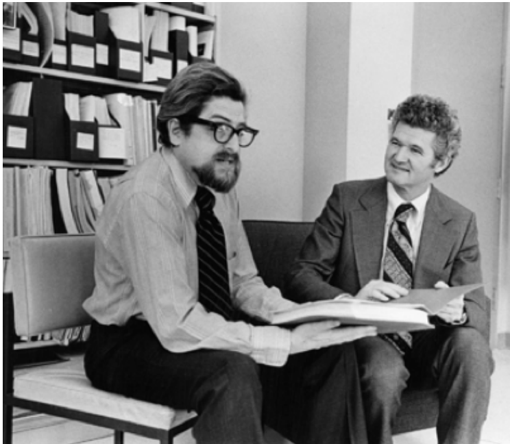
Figure 4 Louis Nirenberg et Peter Lax.