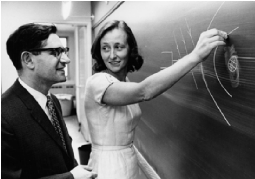
Figure 5 Harold Grad et Cathleen Morawetz.

En 1934, Courant fut engagé pour développer le " programme gradué " de mathématiques à NYU 9 , appelé originellement le Graduate Center for Mathematics .