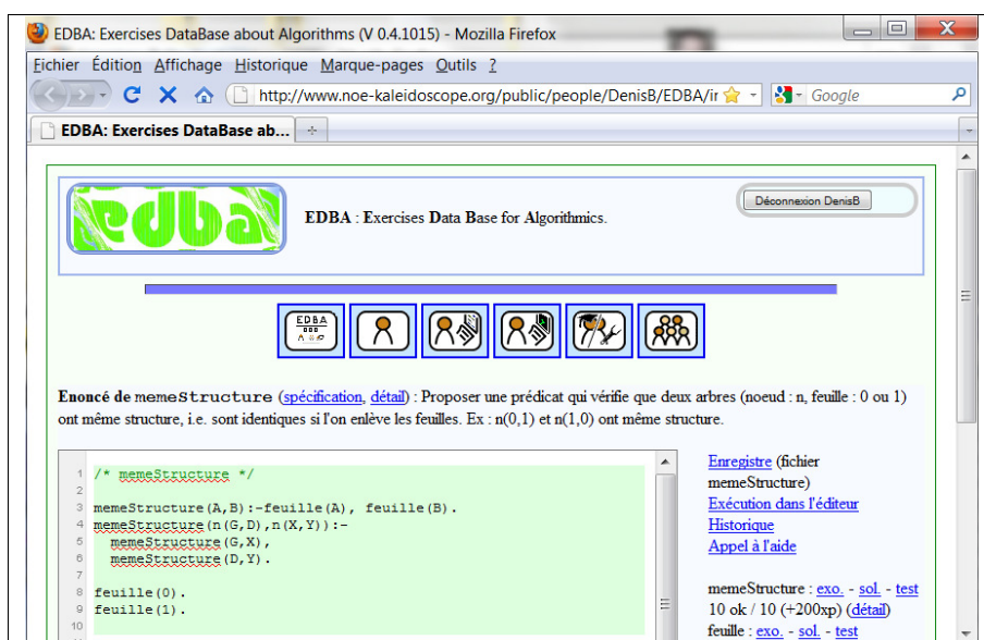
Figure 1. Copie d'écran d'EDB. www.noe-kaleidoscope.org/public/people/DenisB/EDBA/index_EDBA_Full.html

Globalement, toutes les questions posées vont recevoir une réponse positive puisque nous avons réussi à obtenir une première version d'un EIAH réalisé avec AJAX, cf. figure 1. Cependant, un certain nombre de choix ou de solutions ont dû être faits ou trouvés. Certaines solutions sont partielles, certains choix introduisent des limites, ... l'ensemble mérite quelques explications.