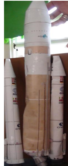
La fusée Ariane 5, exemple de réalisation avec les enfants après la visite.