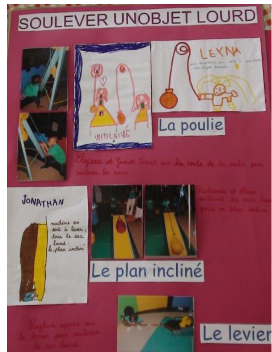
Exemple des panneaux réalisés avec les enfants pour l'exposition organisée après la visite, pour la séance avec les parents : découpage, collage, dictée à l'adulte, dessin