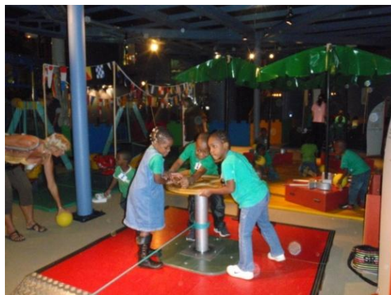
Apprentissage collaboratif : découverte interactive de l'exposition Ile aux Machines ;