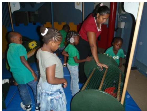
Accompagnement par l'adulte : découverte interactive de l'exposition Ile aux Machines