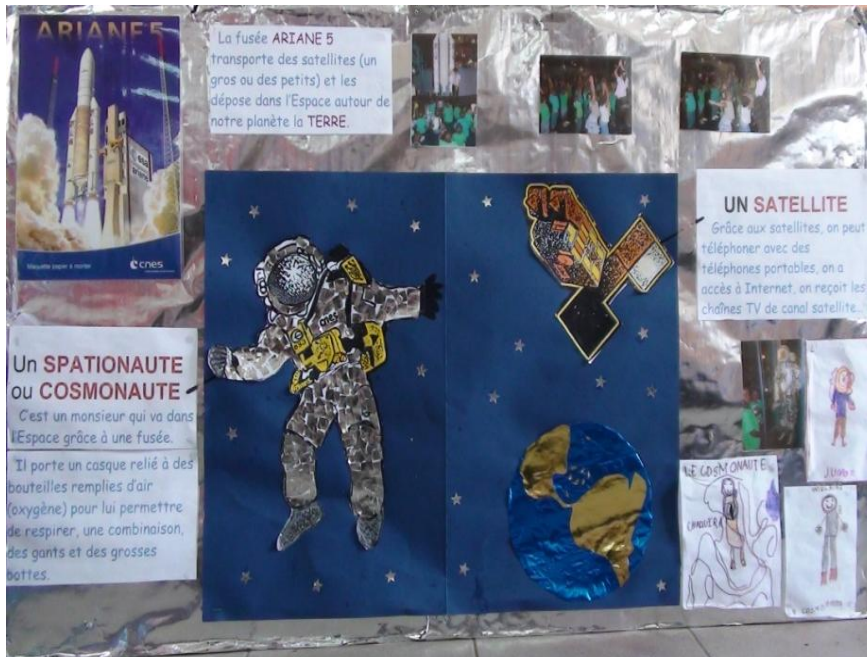
Panneau réalisé avec les enfants après la visite : découpage, collage, dictée à l'adulte, dessins.