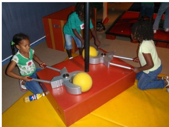
Découverte en autonomie de l'exposition Ile aux Machines expérimentation