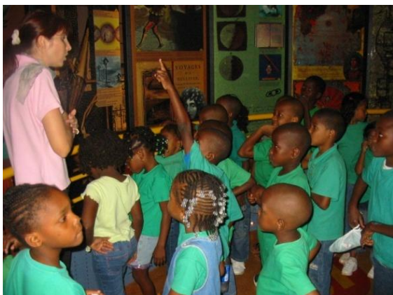
Visite guidée de la Cité de l'Espace de Kourou, extrait de la première partie de la visite