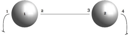
Figure 3 : réseau de jonctions

Imaginons un vaste réseau composé de J jonctions et de ports qui sont des entrées – sorties sur ces jonctions : P . Les ports comme les jonctions sont numérotés. La figure 3 présente une telle structure.