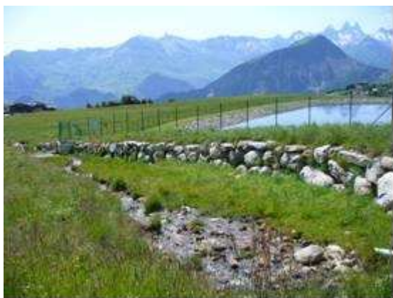
Figure 3 – Retenue soumise à un risque torrentiel avéré

• une retenue sur deux est soumise à un aléa torrentiel, et environ une sur trois est soumise à un aléa fort.