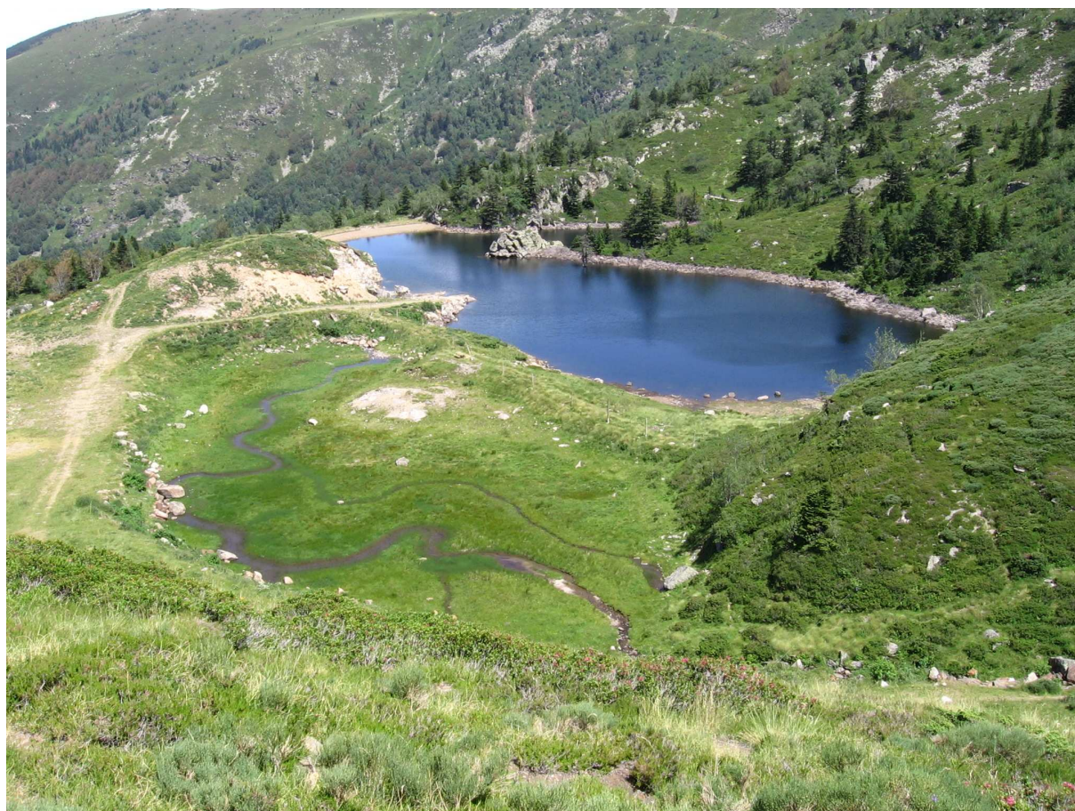
Figure 5 – Retenue partiellement construite sur une zone humide