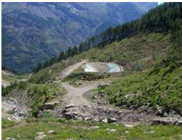
Figure 2 – Retenue d'altitude impactée par une avalanche

• une retenue sur deux est soumise à un aléa torrentiel, et environ une sur trois est soumise à un aléa fort.