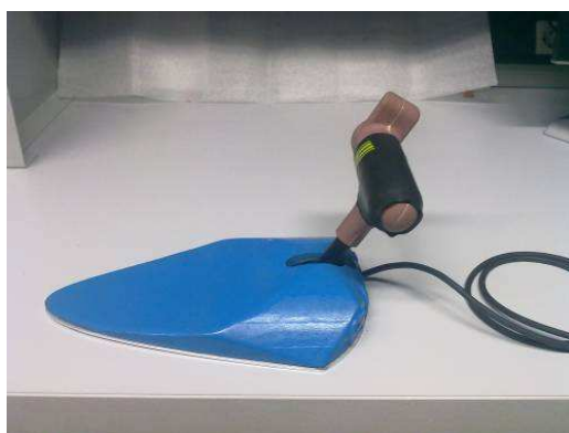
Figure 3. Joystick utilisé par les personnes handicapées pour la pratique de gros instruments de percussion

L'ensemble des éléments permettant l'utilisation de l'actionneur ont été usinés grâce aux machines outils traditionnelles présentes à l'université de Grenoble. Les réalisations électroniques ont été testées dans des salles d'instrumentations dédiées. Actuellement, cette réalisation est en cours de finalisation. Il a clairement été détecté lors de cette seconde phase, que des compétences supplémentaires en électronique avancée étaient nécessaires.