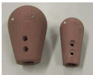
Figure 2. Exemples de pommeaux adaptés amovibles pour la pratique de l'interface par plusieurs enfants

Le système proposé permet donc à des enfants de jouer sur un instrument de musique en l'état actuel de leur maladie. Les handicaps dont souffrent les enfants sont évolutifs : en quelques semaines, les capacités physiques peuvent diminuer fortement. Il est donc envisagé à présent de proposer la conception de système évolutif et donc beaucoup plus évolué techniquement, notamment au niveau des compétences électronique et traitement du signal. Concernant le traitement du signal, plusieurs points sont à traiter :