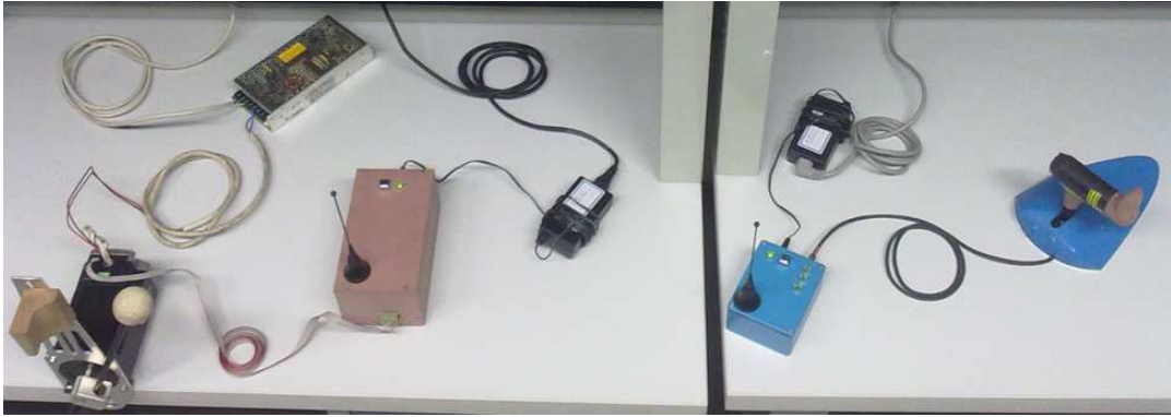
Figure 4. Système complet: à droite, le joystick et l'émetteur, à gauche, le récepteur et le moteur pas à pas rotatif auquel est fixé la mailloche.

Le projet dans sa globalité nécessite un support conséquent de moyens technologiques de fabrication pour certains travaux : la réalisation de la partie mécanique de la nouvelle version de l'interface utilisateur qui devra intégrer l'ensemble de l'électronique de traitement du signal, le support du nouvel actionneur qui devra se positionner à proximité de l'instrument de percussion, etc.