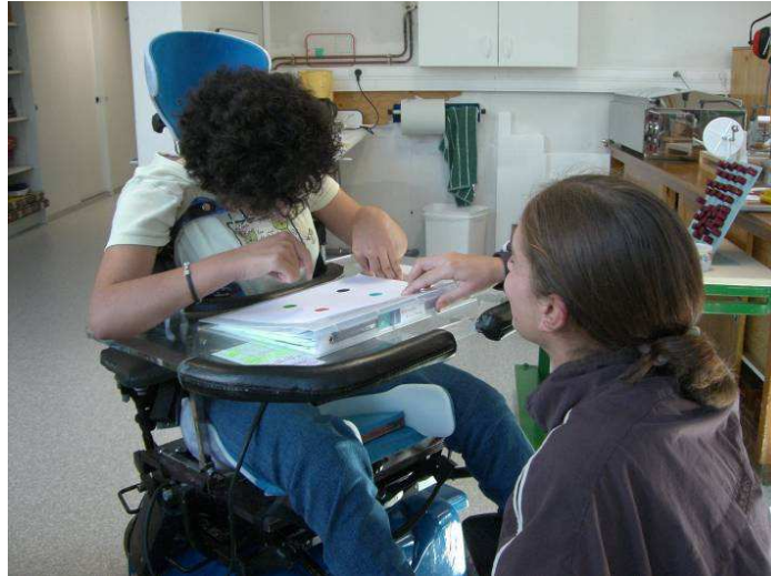
Figure 6. Etudiant avec la personne handicapée lors d'une phase d'expérience permettant de récupérer des données sur les capacités physiques

Dans un second temps, nous proposons de contribuer à la compréhension des activités de manière plus globale en mettant en évidence quelques points forts et bloquants de cette activité.