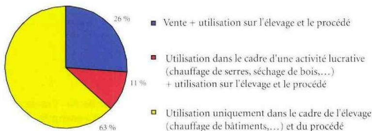
Figure 4 : Les différentes voies de valorisation de la chaleur produite (% des projets étudiés)

Les données présentées précédemment ne sont que la photographie d'une filière en cours d'éclosion qui se cherche et qui sera amenée à évoluer. Même si les intérêts économiques, sociaux et environnementaux ne manquent pas, la France reste encore loin des pionniers de la méthanisation en Europe. Le volet économique restant le nerf de la guerre, le développement de la filière dépend étroitement de la volonté de la puissance publique qui peut intervenir via des subventions à l'investissement et/ou une réévaluation du tarif de rachat actuel de l'électricité (maximum : environ 14c€/kWh) pour rendre les projets économiquement viables. Après subventions, la plupart des projets actuels présentent un temps de retour sur investissement compris entre 6 et 9 ans. Même s'il est difficile de donner un chiffre précis tant le contexte évolue rapidement, l'ensemble des unités réalisées ou en cours de réalisation représenterait une production d'électricité comprise entre 20 et 30 MWé. Difficile donc de soutenir la comparaison avec l'Allemagne qui affiche fièrement plus de 1600 MW électriques produits dans les méthaniseurs agricoles. Souhaitons que ces premiers projets donnent confiance à tous les agriculteurs ou acteurs du monde agricole qui n'osent pas encore concrétiser leur projet de méthanisation. ■