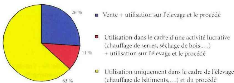
Figure 4 : Les différentes voies de valorisation de la chaleur produite (% des projets étudiés)

Les données présentées précédemment ne sont que la photographie d'une filière en cours d'éclosion qui se cherche et qui sera amenée à évoluer. Même si les intérêts économiques, sociaux et environnementaux ne manquent pas, la France reste encore loin des pionniers de la méthanisation en Europe. Le volet économique restant le nerf de la guerre, le développement de la filière dépend étroitement de la volonté de la puissance publique qui peut intervenir via des subventions à l'investissement et/ou une réévaluation du tarif de rachat actuel de l'électricité (maximum : environ 14c€/kWh) pour rendre les projets économiquement viables. Après subventions, la plupart des projets actuels présentent un temps de retour sur investissement compris entre 6 et 9 ans. Même s'il est difficile de donner un chiffre précis tant le contexte évolue rapidement, l'ensemble des unités réalisées ou en cours de réalisation représenterait une production d'électricité comprise entre 20 et 30 MWé. Difficile donc de soutenir la comparaison avec l'Allemagne qui affiche fièrement plus de 1600 MW électriques produits dans les méthaniseurs agricoles. Souhaitons que ces premiers projets donnent confiance à tous les agriculteurs ou acteurs du monde agricole qui n'osent pas encore concrétiser leur projet de méthanisation. ■