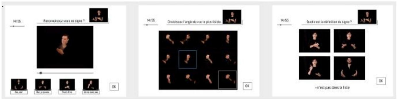
Figure 6 : les 3 étapes de test

Les étapes 1 et 3 forment un ensemble logique indiquant par croisement la reconnaissance ou non du signe. Cependant, la