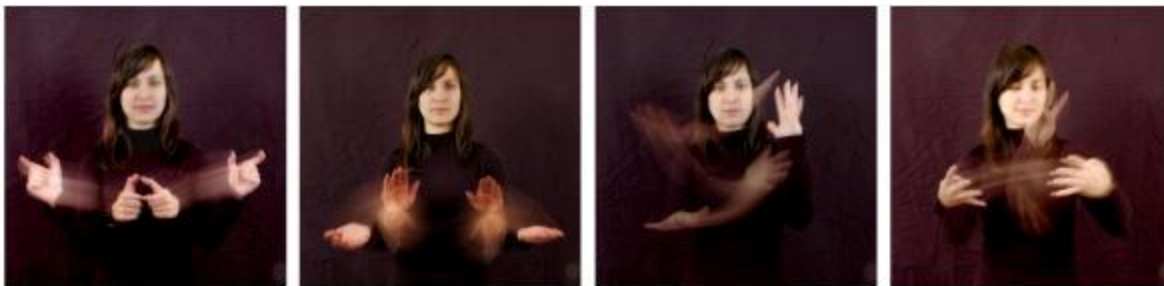
Figure 1 : Premiers essais de prises de vue frontale, de gauche à droite : [arrestation], [voilà], [automne], [calendrier]

Afin d'évaluer méthodiquement la lisibilité, nous avons opté pour une prise de vue multi-angles offrant la possibilité de percevoir la trace du signe, soit en rotation (donnant l'illusion de la profondeur), soit sous plusieurs angles isolés. Cette approche permet par la voie de tests de lecture comparée de dégager des constats sur la lisibilité de notre corpus graphique et de pouvoir concrètement étudier des critères de lisibilité pour un système graphique à venir.