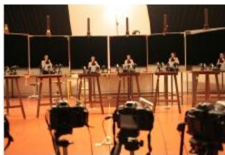
Figure 3 : Photo de l'installation