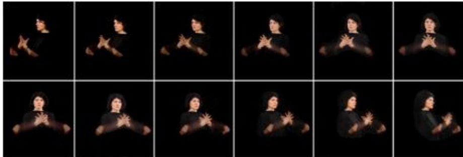
Figure 4 : Série de 12 clichés du signe [disparaître]

Plus de 200 séries de 12 clichés ont ainsi été rassemblées, classées puis retouchées afin de constituer le corpus graphique de l'expérience.