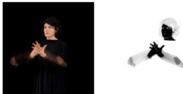
Figure 5 : Image des signes, à gauche registre photographique, à droite registre graphique

Afin de récolter les données nécessaires à notre étude, une plate-forme de test a été réalisée. La volonté de toucher le public le plus large possible nous a conduits à développer le test sur internet. Ce site propose à la communauté sourde un test en ligne portant sur la reconnaissance de signes selon plusieurs angles de vue. Deux registres graphiques font l'objet du test : un registre photographique présentant la trace laissée par le geste et un registre graphique correspondant à un négatif en noir et blanc du premier.