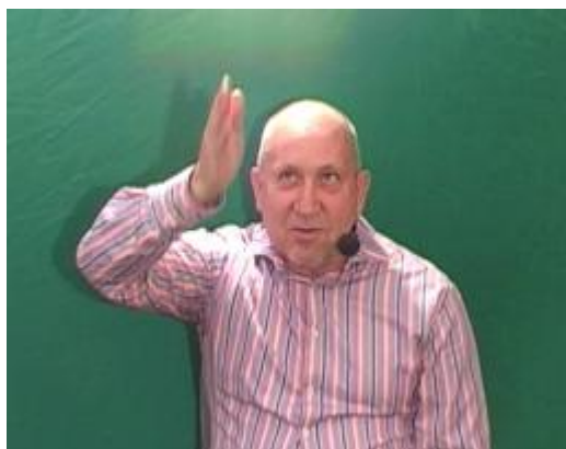
Figure 1: La mire (compteur 1.06)

alignées pendant un laps de temps suffisant 4 . D'autres segments peuvent s'ajouter à cet alignement : le dos de la paume et l'avant-bras voire le bras. Dans certains cas, que nous aborderons, la direction du regard passe par le bout des doigts pointés vers le haut tout comme la main, et vise une zone vers l'avant comme on le ferait d'une cible avec un fusil muni d'une mire verticale dont l'extrémité est orientée vers le haut : la mire verticale est donnée par le bout des doigts étendus. Le corpus étudié montre des exemples de ces pointages/mires pour lesquels la direction du pointage ne dépend pas de l'alignement des segments gestuels. Ainsi, pour analyser le pointage, on peut dissocier alignement gestuel, directionnalité et mouvement.