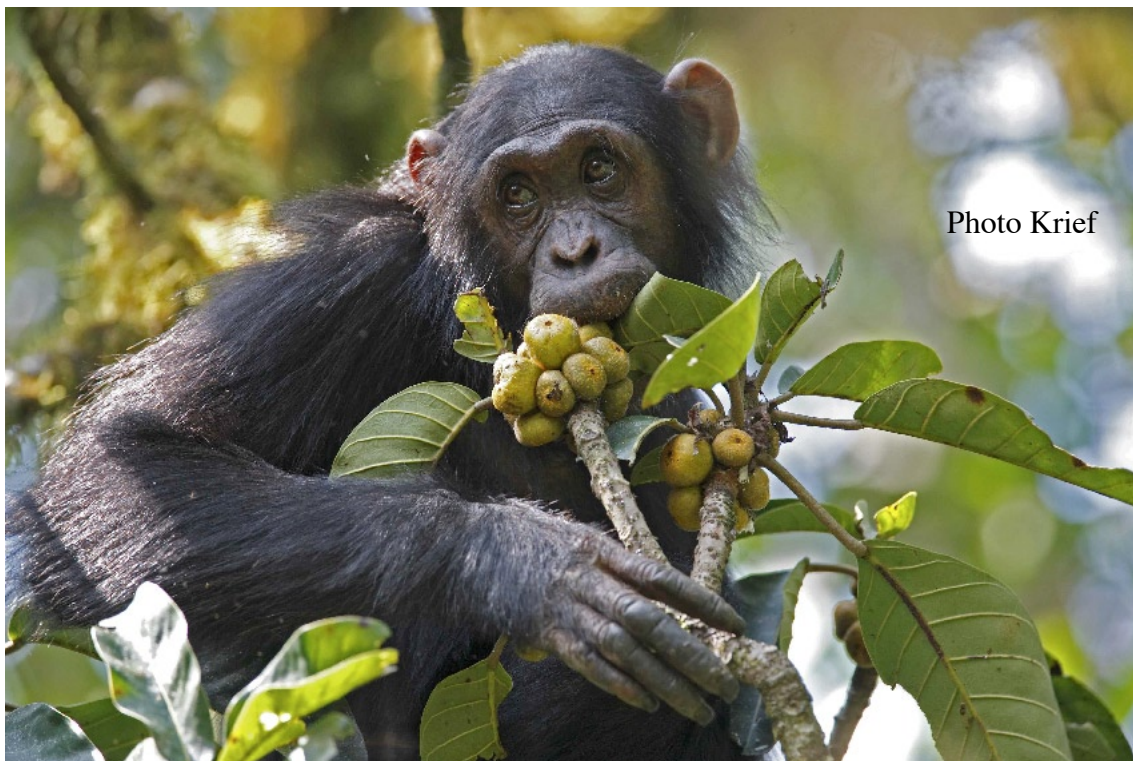
Ipasa, femelle chimpanzé sauvage du Parc National de Kibale, en Ouganda, se nourrit fréquemment de figes. Les grands singes perçoivent et discernent les différents types de sucres présents dans les fruits.

Les primates non-humains ont donc sans doute un goût assez similaire au nôtre. Est-ce en raison de