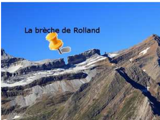
Figure 4: La fameuse brèche de Rolland dans les Pyrénées.