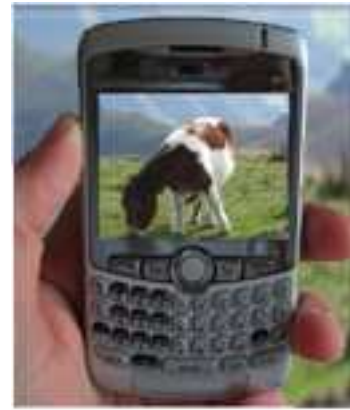
Figure 5: Consultation de la photothèque.