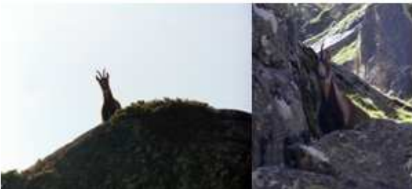
Figure 1: Rencontre inattendue au cours d'une randonnée dans les Pyrénées.

d'une photo soit précis serait d'insérer un "géotag" [4], un marqueur à caractère géographique, directement dans le format de l'image. Cette balise de géolocalisation peut être constituée des coordonnées GPS [1] (latitude, longitude, hauteur), de la direction de la vue en coordonnées polaires, de la date et d'une saisie. Citons par exemple le format Exif (Exchangeable image file format) établi par le JEIDA (Japan Electronic Industry Development) qui permet d'intégrer automatiquement une balise dans un format image.