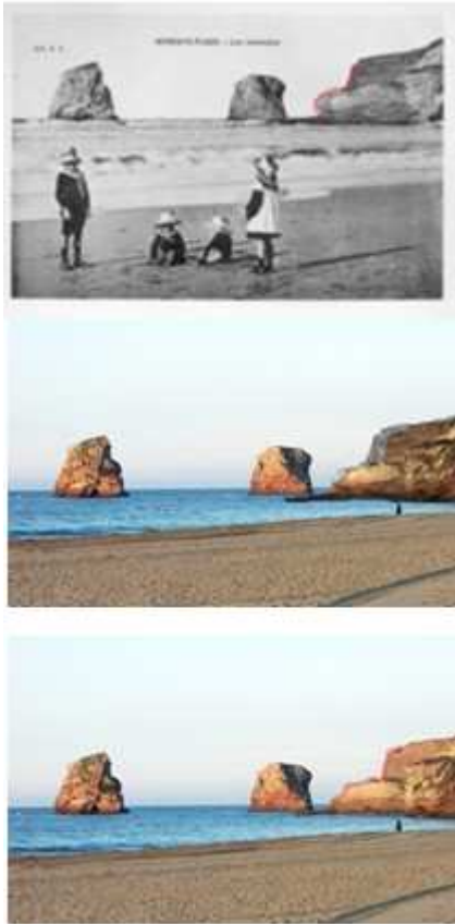
Figure 6: Erosion de la falaise à Hendaye.