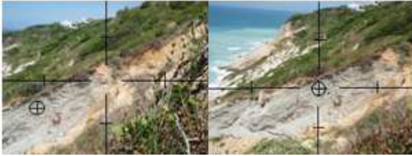
Figure 2: Assistance pour le relevé d'un éboulement de terrain lors d'une promenade sur le sentier du littoral à Bidart.