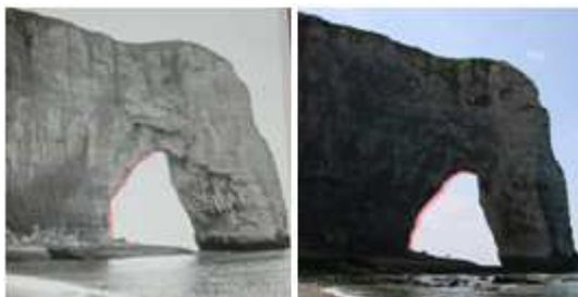
Figure 7: Erosion des falaises d'Étretat.

tectent la ligne d'horizon [13, 3] en séparant la mer du ciel. Pour illustrer l'évolution au cours du temps des reliefs par exemple, la technique de "morphing" est très démonstrative [5]. Dans le cas du morphing qui consiste à transformer une image 2D en une autre, les pourtours des reliefs sont détectés dans les deux images puis étirer d'une image à une autre, tout en créant des images intermédiaires (voir figure 6).