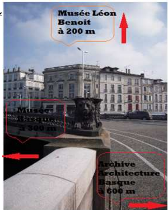
Figure 2: Interface visuelle prévue pour MARTS.

L'un des objectifs de la réalité augmentée est d'améliorer la perception ou la visibilité du monde physique. L'écran du Smartphone se comporte comme une lucarne sur le monde réel dont on peut augmenter le flux vidéo. Nous nous appuyons sur les données géo-référencées des objets pour informer l'utilisateur sur sa localisation comme le montre la figure 2 par exemple où l'on voit l'information de localisation des différents POIs situés à proximité. Il est en effet impossible d'équiper de marqueurs artificiels tous les éléments du monde réel. Nous devons donc mettre en oeuvre un calcul de la pose de la caméra par un système sans marqueur ("markerless"). Le système calcule la position de l'utilisateur en utilisant les données GPS et celles de la boussole. Pour