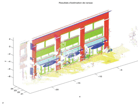
FIGURE 1 – Extraction des plans significatifs

Après plusieurs essais, nous avons choisi une valeur de \delta = 10mm . La figure 1 montre les différents plans extraits du nuage de points.