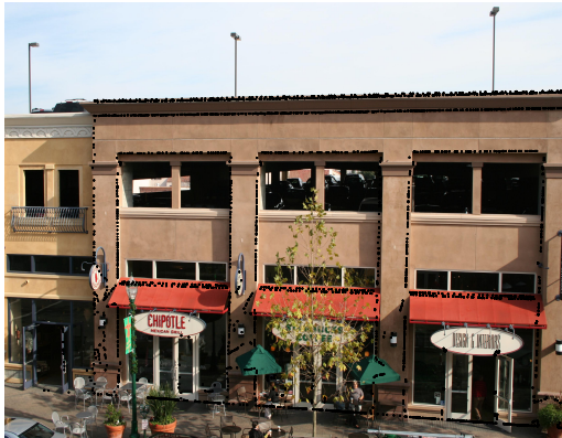
FIGURE 3 – Résultat du recalage

Une approche permettant le recalage de données TLS et d'images photographiques de bâtiments a été proposée. Ce travail s'inscrit dans le cadre de la maintenance et de l'isolation thermique extérieure de bâtiments anciens