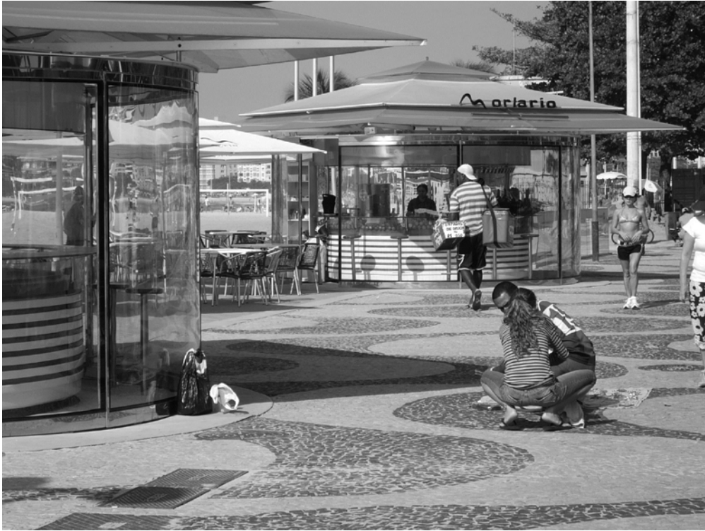
Photo4 Nouveaux Kiosques et vendeurs ambulants, avril 2008

Ces vendeurs utilisent des supports de plus en plus mobiles pour s'éclipser ou passer sur l'espace du sable et se mêler aux autres vendeurs autorisés. Sur le trottoir des petits chariots en forme de noix de coco sont apparus, ils sont tenus par des vendeurs ambulants mais employés par les nouveaux kiosques pour vendre la fameuse boisson rafraîchissante.