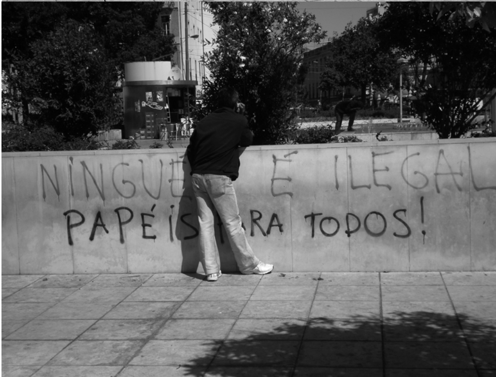
Photo5 et 6 Place Martim Moniz rénovée et pratiques informelles