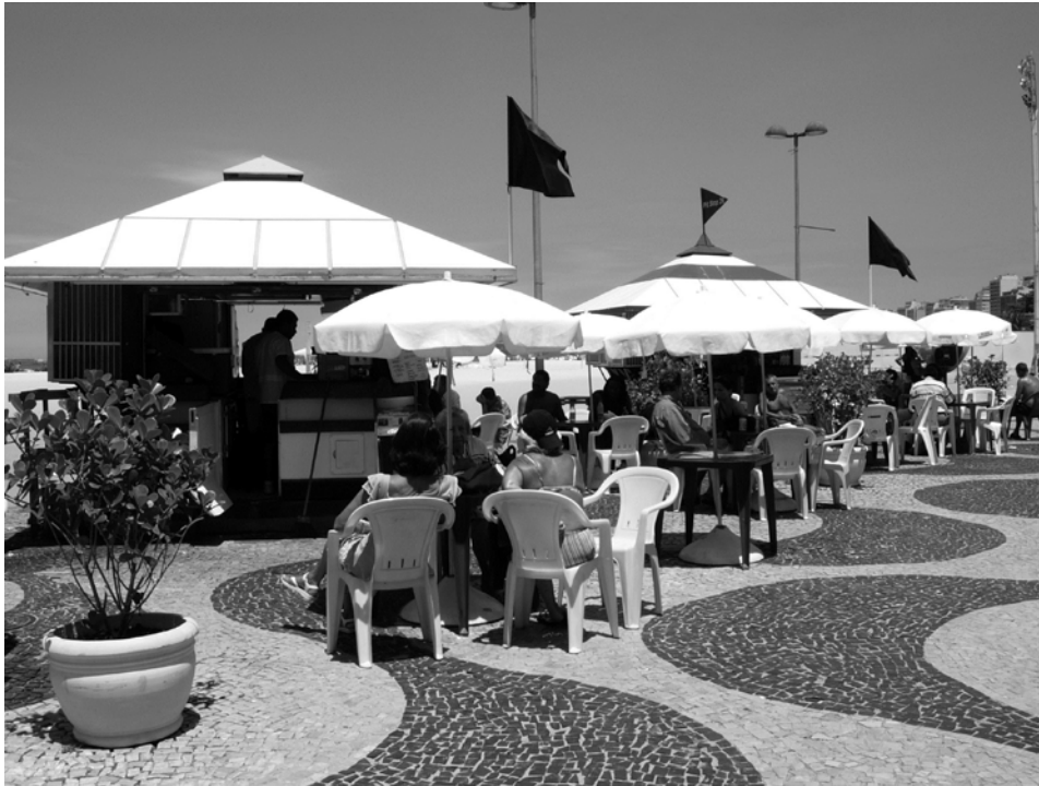
Photo 3 Anciens Kiosques en « résistance », drapeau noir sur le front de mer octobre 2006

front de mer devient un lieu de protestation et les quiosqueiros hissent un drapeau noir sur le toit des Kiosques et déclarent le front de mer en deuil.