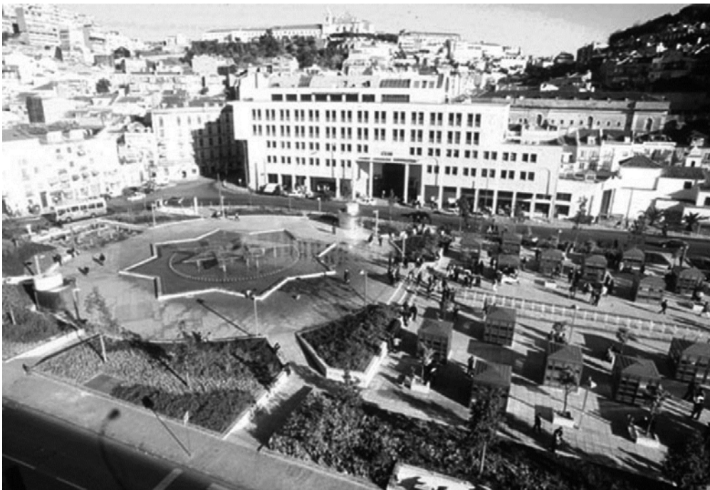
Photo 1. Praça de Martim Moniz, 2004

Mouraria un quartier de Lisbonne, la création de la place Martim Moniz