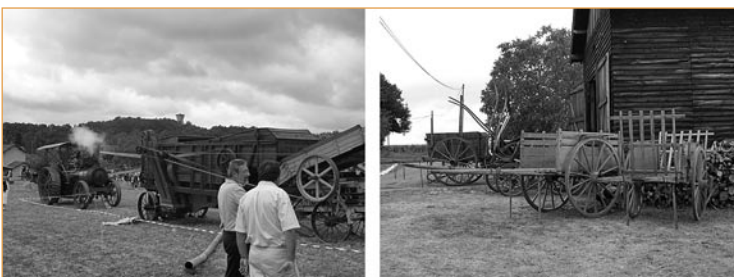
▼ Figure 3 – Les festivités de l'« agricolité ».

De fait, les festivités organisées jouent de plus en plus la carte de « l'agricolité » (Lescureux, 2003) : elles ont l'appellation et les saveurs de l'agriculture mais la présence même des producteurs devient marginale (figure 3). Cette « agricolité » est reprise de manière anarchique par de nombreuses communes, comités des fêtes et/ou associations du patrimoine, qui réinventent toutes sortes de fêtes et de marchés traditionnels sur les cendres des foires ou des comices agricoles. D'ailleurs, ce terme est souvent abandonné ; on lui préfère souvent le nom du produit régional (fête de la noix, fête du foie gras, fête du cèpe...) pour marquer l'identité locale, ou ceux plus génériques de « marché paysan » ou de « marché fermier » pour souligner l'authenticité et la convivialité de l'évènement, et donc lui conférer des vertus affectives, sociales et culturelles. C'est d'ailleurs sous cet angle que le pays du Grand Bergeracois communique sur les marchés saisonniers ou permanents dont il assure la promotion : « un lieu de rencontre et de convivialité pour continuer à apprécier ces moments de la vie quotidienne ». L'existence