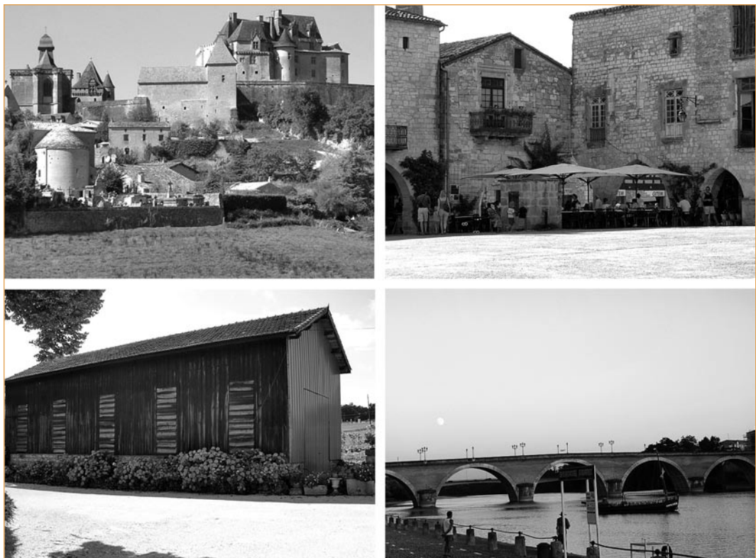
► Figure 2 – Illustration des « réservoirs d'images » du Sud Dordogne.

Par sa capacité à faire émerger une identité positive et à donner aux habitants le sentiment d'une certaine compétitivité, le développement culturel confère une épaisseur aux discours d'existence des nouveaux territoires. Même s'il ne saurait se résumer à cela, ce nouvel instrument des politiques publiques renforce ainsi le processus de « la petite fabrique des territoires » (Vanier, 1995). Il donne aux nouveaux territoires les « alibis géographiques » permettant à ces structures émergentes de se parer des parfums de l'authenticité, d'ancrer leur réalité dans l'ordre naturel des choses et de se dissimuler derrière l'illusion d'une dynamique endogène. Cette logique permet de convaincre les populations concernées de la pertinence de ces projets exhumés de logiques volontaristes et liés à des enjeux politiques. Mais si le développement culturel joue un rôle très important dans la transformation et l'organisation du territoire du Grand Bergeracois en produit d'appel « monnayable », on peut s'interroger sur ses supposées vertus sociales. En effet, quels sont les impacts en termes de cohésion et de lien social de ce marketing territorial construit avant tout à destination de l'extérieur ?