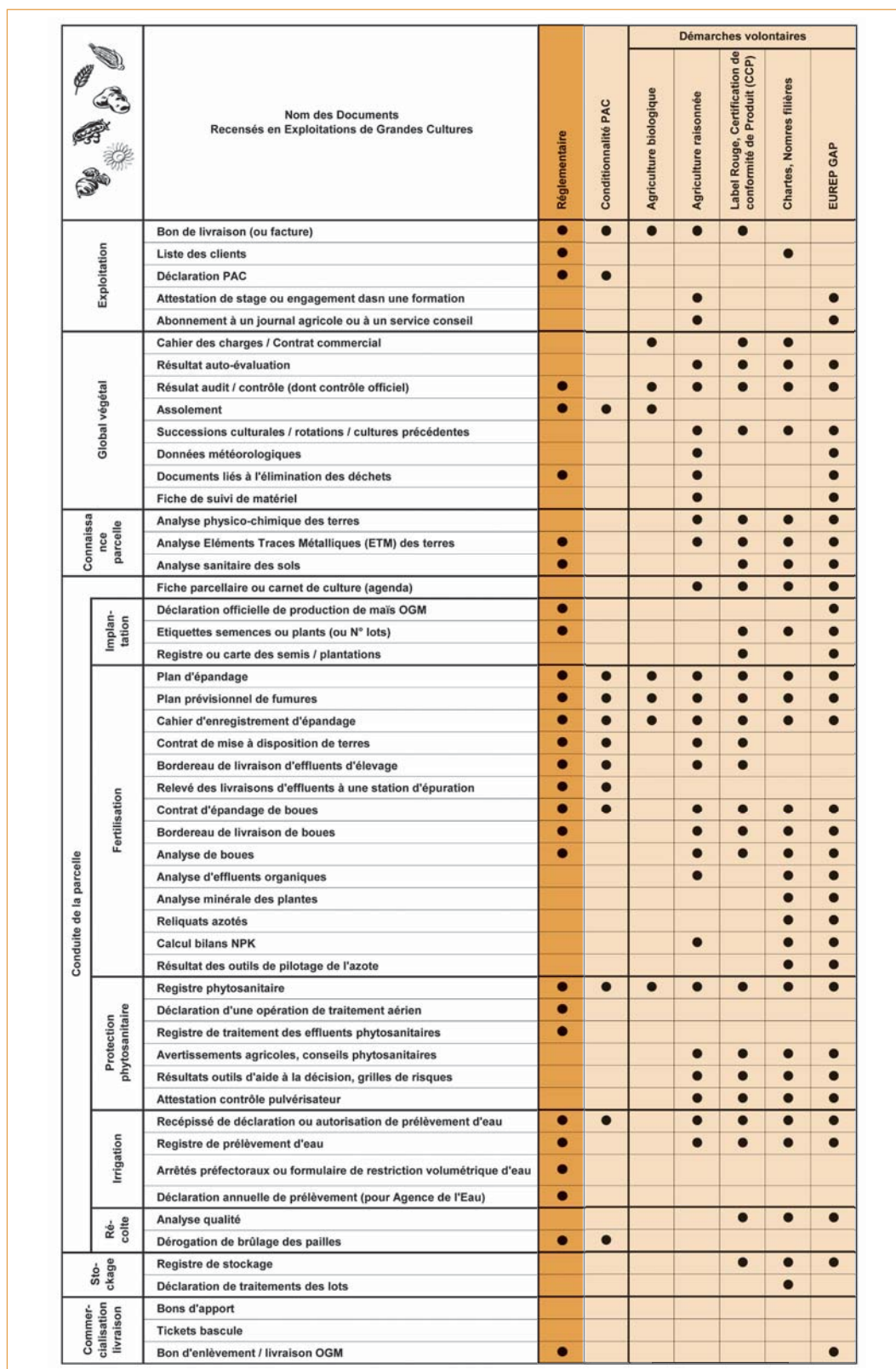
► Tableau 2 – Documents recensés en exploitations de grandes cultures et démarches contrôlant leur présence.