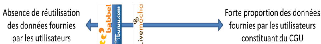
Figure 4. Représentation des trois communautés sur un axe selon notre critère d'horizontalité

usages le « contenu annexe » pourrait s'avérer plus utilisé que le contenu principal, il ne semble pas que ce soit le cas. De plus, du point de vue conceptuel, c'est ce dernier qui est au centre de la conception des sites et tant que la place du premier n'est pas réévaluée et ses données mieux intégrées et structurées, il ne peut, à notre sens, présider au degré d'horizontalité. Cette échelle nous permet de traiter via le même critère le contenu au sens le plus strict et le moins strict, prenant ainsi en compte la variété des utilisations.