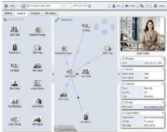
Figure 1: Capture d'écran du réseau d'un acteur au sein d'une organisation (tel qu'il apparaît via l'outil SNA)