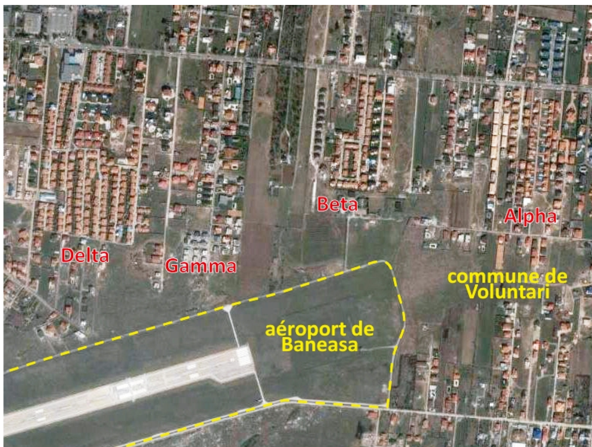
Image : Les résidences fermées au bord de la piste de l'aéroport de Baneasa (2007).

La libéralisation du marché et la spéculation, alimentée par l'argent des Roumains partis travailler à l'étranger, font exploser le marché immobilier, dont les prix doublent entre 2003 et 2006, dans la perspective d'adhésion à l'UE ( carte 2 ). L'accès à la propriété des nouveaux ménages devient presque impossible, au moment où l'Etat restreint la construction de logements sociaux. Les litiges liées aux restitutions et la spéculation foncière favorisent l'étalement urbain de la capitale : loin du centre, les terrains sont abordables et leur statut moins incertain. Cet étalement est un trait essentiel de Bucarest qui reste une ville « basse », à la croissance plus horizontale que verticale. Les autorités qui avaient cherché à l'endiguer dès le début du XX ème siècle, sans y parvenir, s'y trouvent à nouveau confrontées, avec les coûts édilitaires que cela implique.