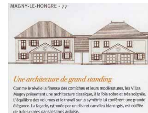
Détail de la Brochure Nexity pour Les Villas Magny.