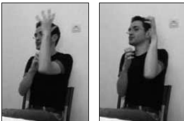
Figure 2 : Olivier produit « l'ours grimpe » en TS (2.a) puis en TP et (2.b)