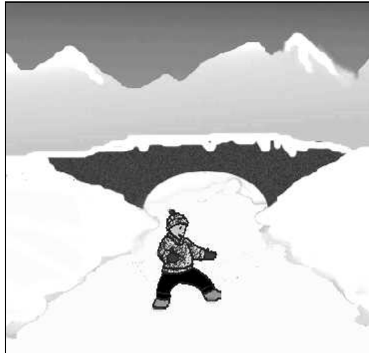
Figure 4 : item « traverser en glissant » des stimuli « déplacements volontaires ».