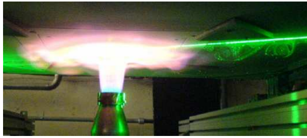
FIG. 1 – Photographie du banc Interaction flamme-paroi (ONERA Toulouse).