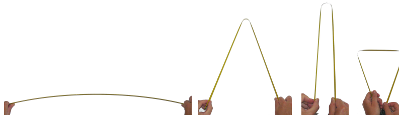
FIGURE 1 – Pliage d'un mètre tuban.