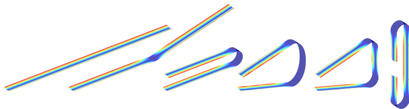
FIGURE 3 – Exemple de scénario modélisé : pliage simple puis séparation d'une zone de pliage en deux. Reconstruction des déformées tridimensionnelles à partir des résultats du modèle 1D de poutre proposé.

Le modèle est implémenté dans Comsol qui permet d'exploiter directement les expressions des énergies en formulant le problème à l'aide du principe d'Hamilton. La figure 3 permet d'illustrer la capacité du modèle de poutre à rendre compte des phénomènes mentionnés dans l'introduction.