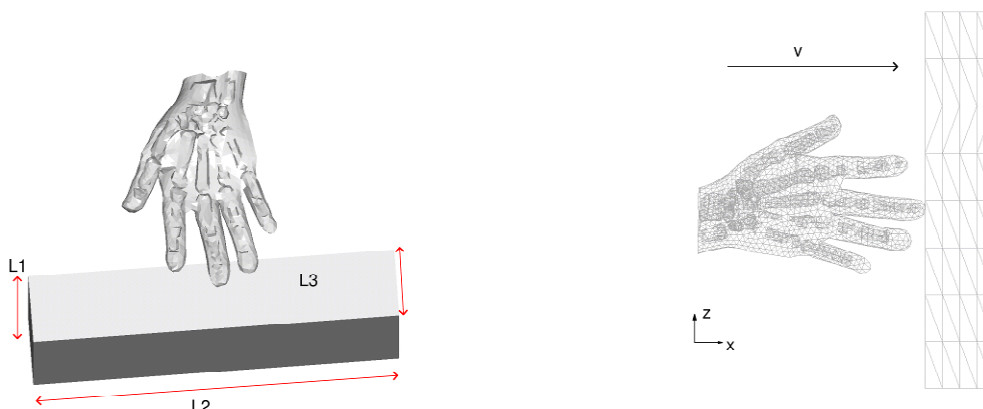
Figure 1 : description du problème

Le but de notre travail est d'étudier la pression de contact entre une main et un objet : lors de la manipulation d'objet par des opérateurs à l'aide d'outils à main par exemple ou bien pour des aides à la formation, comme un dispositif haptique. L'évaluation de la répartition des pressions de contact et de leur évolution au cours du temps est un point critique et extrêmement important. Ceci nécessite une modélisation réaliste du problème et notamment des tissus mous. Ce problème peut être très complexe en raison de la présence de deux phénomènes fortement non-linéaires : le contact/impact et l'hyperélasticité. Pour ce faire, nous nous sommes intéressés à l'élaboration d'un modèle éléments finis 3D non-linéaire d'une main en contact/impact potentiel avec un objet de forme parallélépipédique (Figure 1).