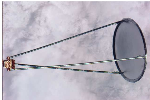
FIGURE 1 – Antenne parabolique gonflable.

L'idée d'utiliser des dispositifs gonflables pour des applications spatiales est ancienne puisqu'elle remonte à la fin des années 1950. Les premières applications qui ont vu le jour sont les satellites de communication ballons de la série ECHO faisant 30 m de diamètre. En 1996, le premier démonstrateur d'antenne gonflable a été mis en orbite. Cette antenne, appelée " Inflatable Antenna Experiment " (IAE), est constituée d'un réflecteur parabolique de 14 m de diamètre dont le rapport focale/diamètre vaut \frac{f}{D} = 0,5 . La lentille est surmontée d'une structure support elle-même constituée d'un tore de 61 cm de diamètre et de bras de 28 m de long la reliant à sa navette parente située au point focal.