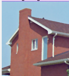
Filtre Vecteur Médian