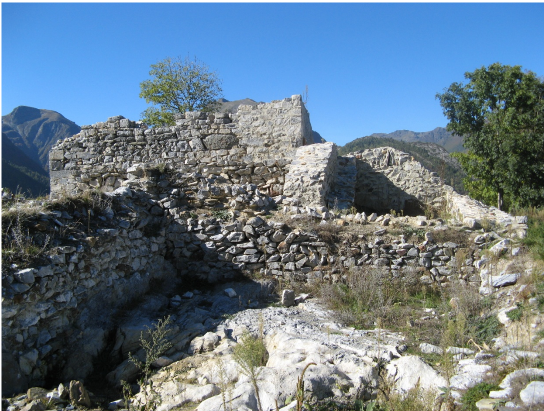
Figure 3 : le caput castris