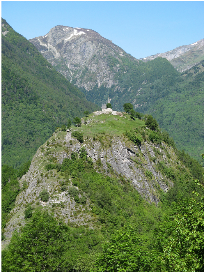
Figure 1 : Le château de Montréal-de-Sos, éperon calcaire au-dessus du bassin d'Auzat-Vicdessos.

L'éperon de Montréal-de-Sos domine ce bassin de 200 à 250 m de haut (fig. 1).