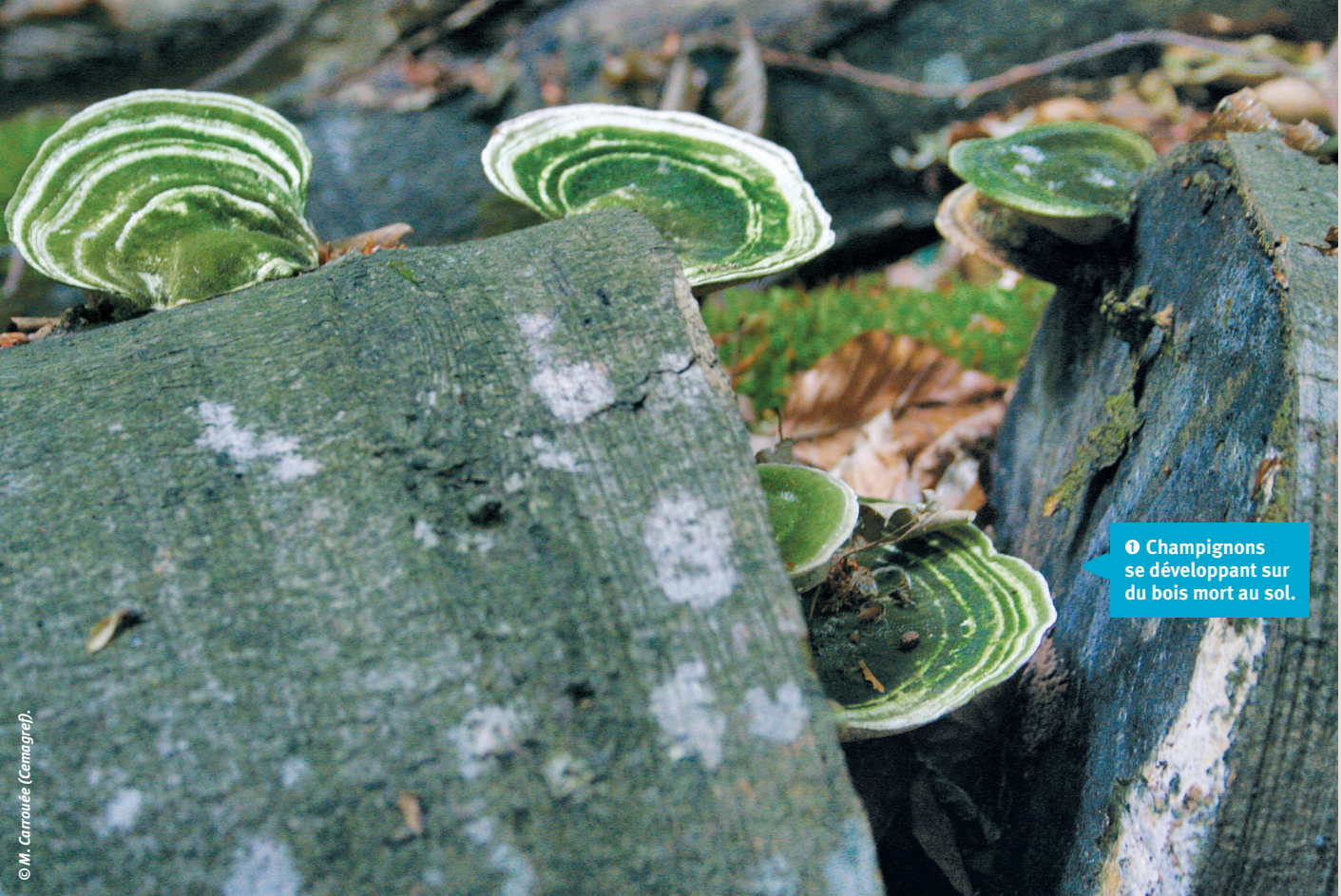
❶ Champignons se développant sur du bois mort au sol.

Faute de consensus dans la communauté scientifique sur les méthodes à employer, il existe pratiquement autant de protocoles d'échantillonnage que de suivis eux-mêmes. Le cas le plus frappant est celui du réseau PIC-Forêt lancé en 1985, sous l'égide de l'UNECE (United Nations Economic Commission for Europe). Ce programme international de coopération a été lancé pour étudier l'effet de la pollution transfrontalière sur les écosystèmes forestiers. Ce réseau comprend deux sous-ensembles de sites ; l'un (niveau II) est constitué de 800 sites dans lesquels de nombreuses mesures physiques et chimiques sont réalisées selon les mêmes protocoles standardisés. Un suivi floristique a été mis en place vers 1995 sur l'ensemble de ces sites. Faute de consensus entre les participants et d'arbitrage, la surface élémentaire des placettes des relevés floristiques variait de 4 000 à 5 500 m 2 , avec parfois même des fluctuations entre placettes d'un même pays ! Or le nombre d'espèces croît très logiquement avec la surface considérée (il existe une riche littérature sur cette relation aire-espèces). Le résultat est que ces données n'ont jamais pu faire l'objet d'analyses conjointes. Il a fallu attendre près de dix ans pour que la volonté de construire un protocole commun soit entièrement partagée par tous les participants et aboutisse finalement au choix d'une surface élémentaire unique – 400 m 2 dans ce cas – pour suivre les évolutions temporelles de la flore à l'échelle du réseau.