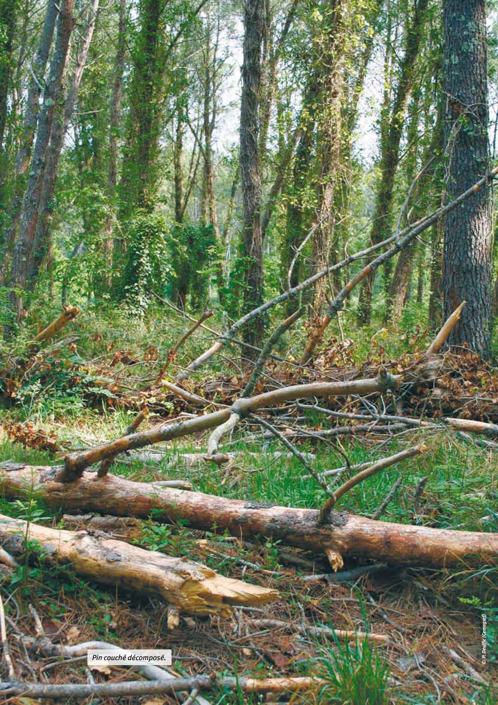
Pin couché décomposé.