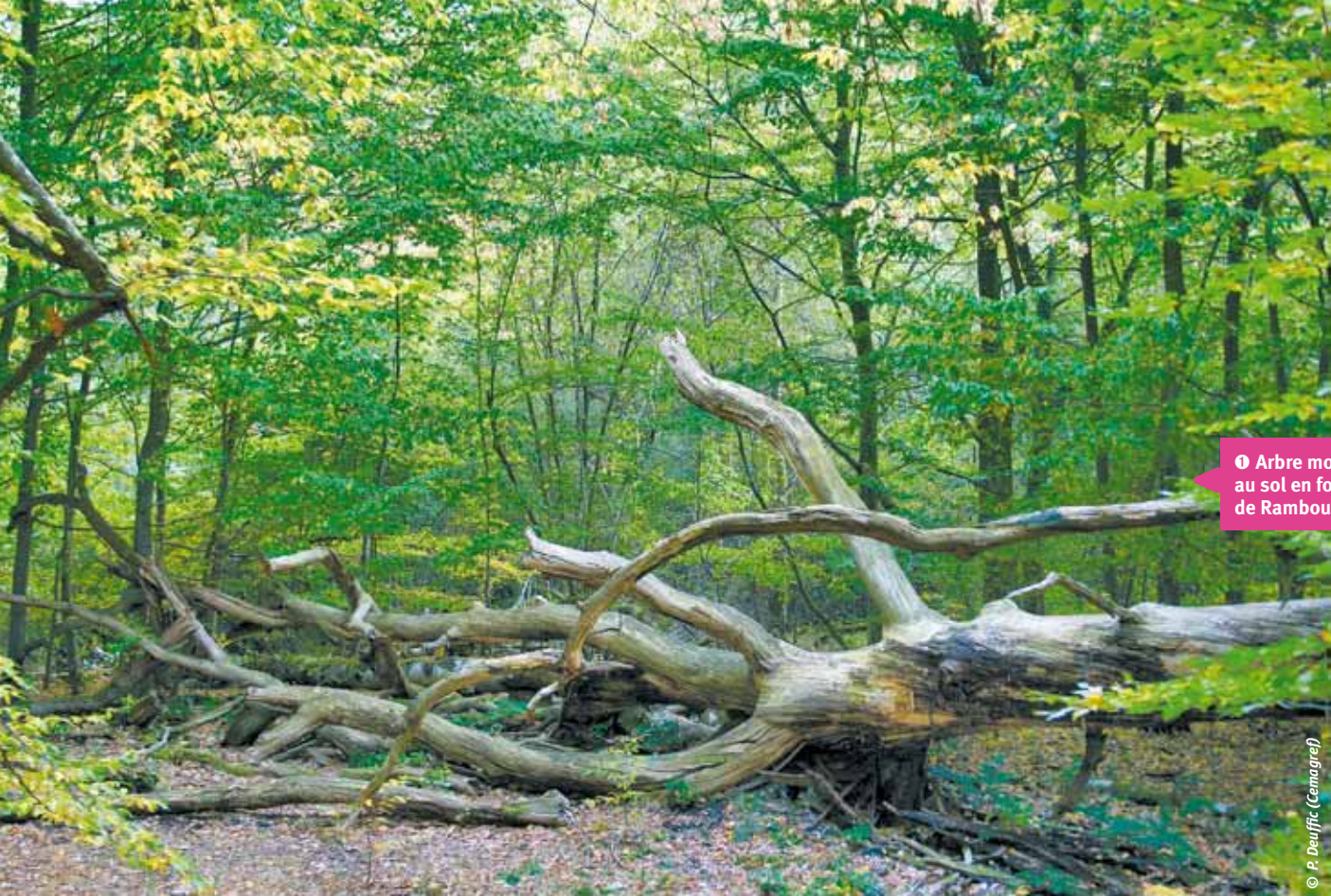
❶ Arbre mort au sol en forêt de Rambouillet.