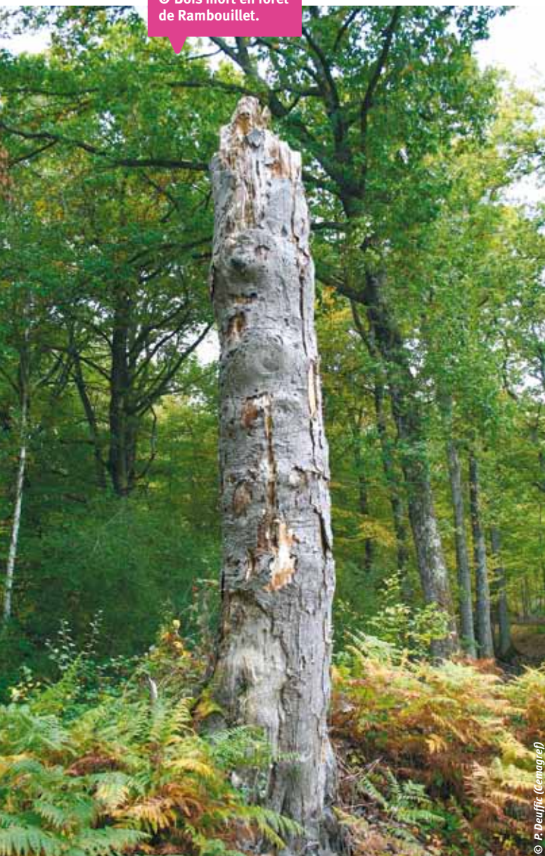
⊗ Bois mort en forêt de Rambouillet.

► Ces trois groupes font aussi part de leurs fortes préoccupations vis-à-vis des risques phytosanitaires : la flore et surtout la faune associées au bois mort sont encore largement perçues comme des ravageurs. La plus-value fonctionnelle des prédateurs de ravageurs est d'autant plus ignorée que les scientifiques eux-mêmes n'ont pas réellement évalué leur impact. Ils expriment aussi le besoin d'une justification fonctionnelle de la rétention de bois mort dans l'écosystème. Ils sont de plus en plus sensibles à l'idée de valoriser les bois morts au sein de la filière bois-énergie malgré les risques en matière de fertilité du sol et les conséquences en matière de biodiversité. Quant au risque d'accident, même s'il est considéré comme faible, l'évacuation des bois morts permet à leurs yeux de le réduire à zéro. A contrario , les « forestiers environnementalistes » du groupe G4 sont évidemment beaucoup plus enclins et convaincus de l'intérêt de conserver du bois mort pour les raisons à peu près inverses des trois groupes précédents.