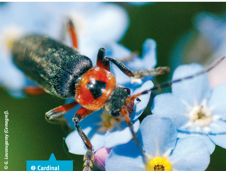
© G. Loucaugaray (Cemagref). Cardinal sur myosotis.