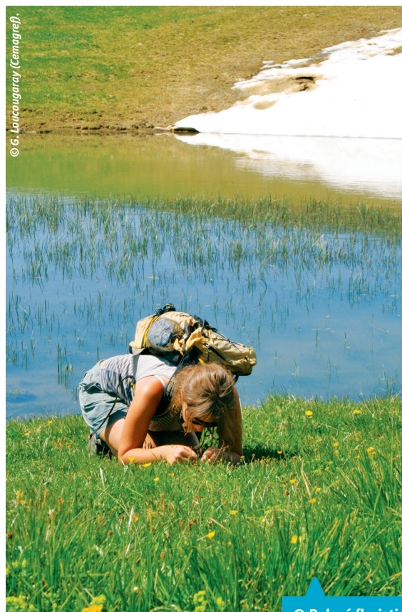
③ Relevé floristique en montagne.