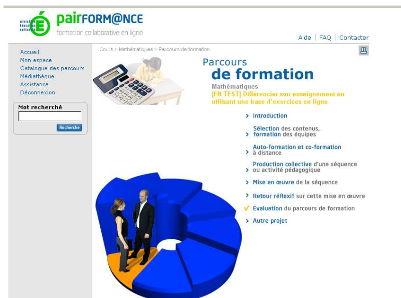
Figure 1. La plate-forme nationale Pairform@nce et les 7 étapes d'un parcours de formation

Pairform@nce mobilise donc trois types d'acteurs : les concepteurs de parcours (qui seront mis en ligne sur une plate-forme nationale après une expertise), les formateurs qui vont concevoir des formations s'appuyant sur ce parcours dans les académies, et enfin les enseignants stagiaires qui vont suivre ces formations et concevoir des ressources pour leurs propres classes. Le dispositif suppose une certaine homogénéité des parcours : ceux-ci doivent être structurés en 7 étapes : entrée dans la formation, sélection des contenus d'enseignement, co et autoformation, conception de situations, mise en œuvre de la situation dans la classe, retour réflexif, évaluation de la formation (fig. 1). Ces 7 étapes, et les ressources à concevoir pour chacune, sont précisées dans un « cahier des charges du concepteur ».