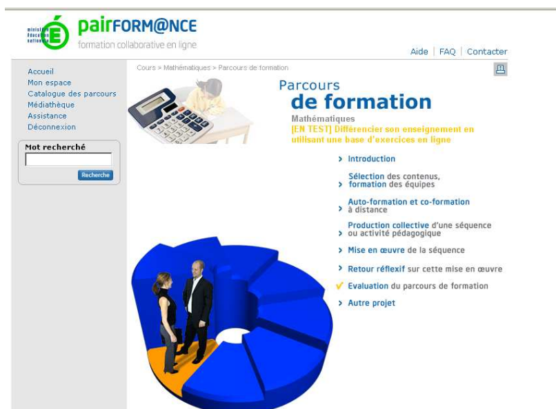
Figure 1. La plate-forme nationale Pairform@nce et les 7 étapes d'un parcours de formation

Pairform@nce mobilise donc trois types d'acteurs : les concepteurs de parcours (qui seront mis en ligne sur une plate-forme nationale après une expertise), les formateurs qui vont concevoir des formations s'appuyant sur ce parcours dans les académies, et enfin les enseignants stagiaires qui vont suivre ces formations et concevoir des ressources pour leurs propres classes. Le dispositif suppose une certaine homogénéité des parcours : ceux-ci doivent être structurés en 7 étapes : entrée dans la formation, sélection des contenus d'enseignement, co et autoformation, conception de situations, mise en œuvre de la situation dans la classe, retour réflexif, évaluation de la formation (fig. 1). Ces 7 étapes, et les ressources à concevoir pour chacune, sont précisées dans un « cahier des charges du concepteur ».