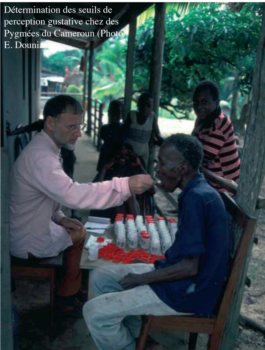
Détermination des seuils de perception gustative chez des Pygmées du Cameroun

HLADIK C.M. (1989) — Perception gustative et qualités organoleptiques des aliments. In : C.M. HLADIK, S. BAHUCHET et I. de GARINE (Eds.). Se nourrir en forêt équatoriale : Anthropologie alimentaire des populations des régions forestières humides d'Afrique . Unesco, Paris : 67-68.